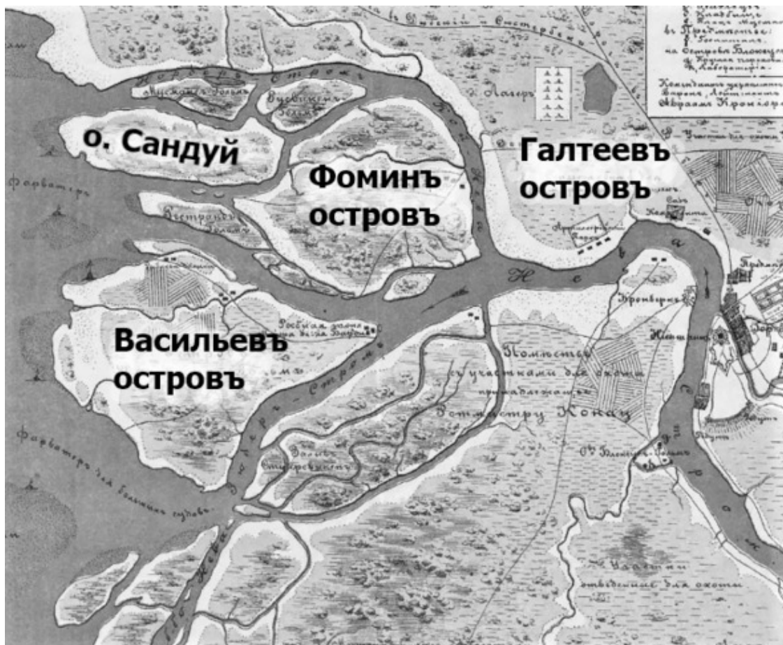
Рисунок 1.2. Наименования основных островов в дельте Невы на «Плане местности, занимаемой ныне Санкт-Петербургом, до завоевания ее Петром Великим, с показанием существовавших на ней шведских укреплений». 1698 год. Опубликовано в русском переводе Р. Е. Шварцем в 1872 году

На рис. 1.2 представлен «План местности, занимаемой ныне Санкт-Петербургом» 1698 года, на котором мы обозначили остров Сандуй , Фоминъ островъ , Васильевъ островъ и Галтеевъ островъ (о последнем см. Раздел 3.6).