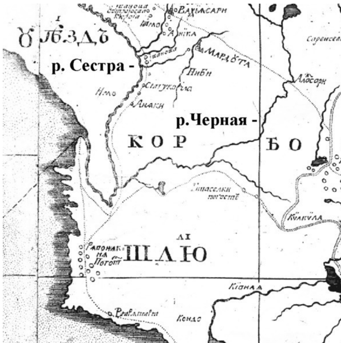
Рисунок 2.1. Изображение низовьев Сестры на карте «Географический чертеж Ижорской земли Адриана Шонбека, 1705 г.» [12]

вало, река Сестра текла от нынешнего Белоострова на юг, принимала в себя воды р. Черной, делала в районе нынешней Тарховки крутой поворот почти на 180° и далее текла на север, впадая в Финский залив в районе нынешнего санатория „Дюны“. Такая ситуация зафиксирована на наиболее подробных шведских и русских картах конца XVII – начала XVIII вв., две из которых приводятся ниже...» [44]. Фрагмент одной из них (русской карты) приведен на рис. 2.1.