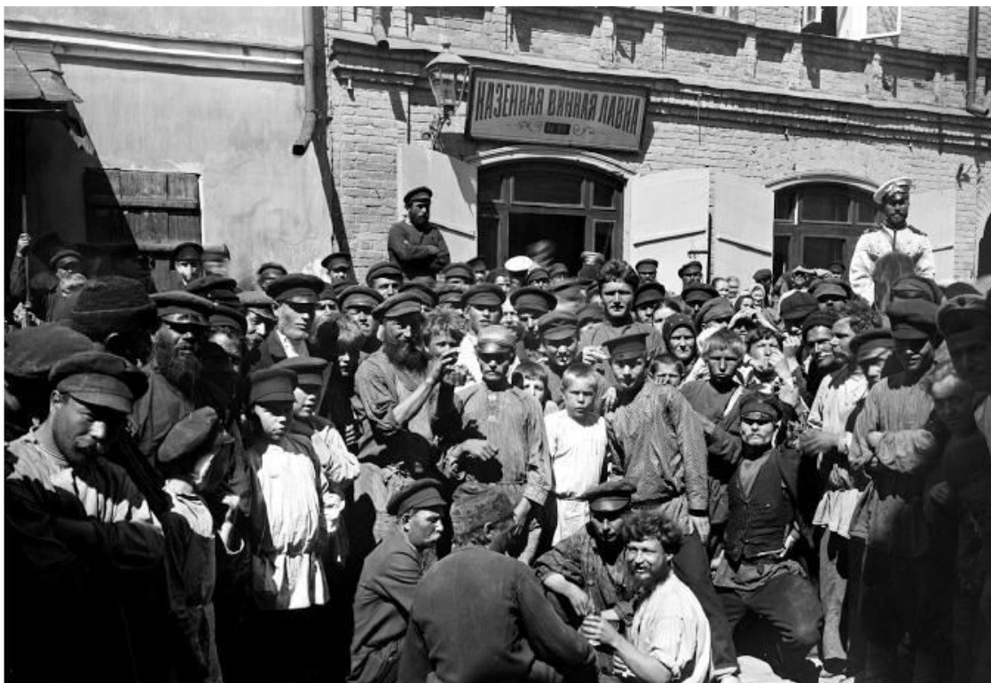
У казенной винной лавки в Нижнем Новгороде

Почему же у всех было ощущение, что русский мужик пропадает и надо его как-то спасти? Потому что водка была атрибутом престижного потребления. Сейчас у нас есть много возможностей продемонстрировать окружающим жизненный успех и достаток: купить коллекционные «аидасы», выложить в соцсети фотографию с отдыха в Турции, приобрести, в конце концов, последнюю модель айфона. Сто двадцать лет назад такого ассортимента не было. Можно было купить смазные сапоги, поднатужиться и завести патефон или баян, но на все это приходилось копить. Водка стоила дороговато, 68 копеек за литр, – примерно дневной заработок крестьянина. Но крестьянину требовалось еще кормить семью: не разгуляешься.