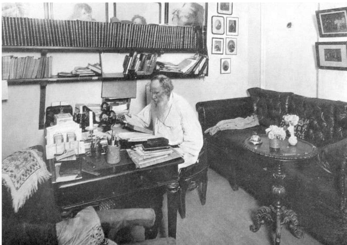
Лев Толстой за работой в Ясной Поляне

Толстой упорствовал. Он даже достал из ящика стола незаконченный роман «Воскресение» и принялся за старое: вместо философских и духовных статей пишет роман о трагической любви. Долгожданный «камбэк» тут же перевели на многие языки, а Лев Николаевич, получив гонорар, пожертвовал его на переселение духоборов. Было решено отправить их в Канаду, где они могли бы без притеснений жить согласно своим пацифистским воззрениям.