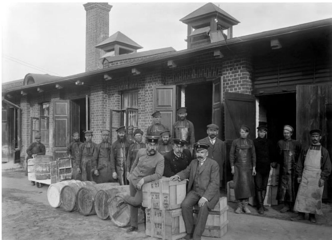
Казенный винный склад

Цена эта была высокой, так что конкурировать с казенной водкой смысла не было никакого. Поэтому частные производители, например Шустов, делали водку намного выше качеством, чтобы оправдать ее стоимость.