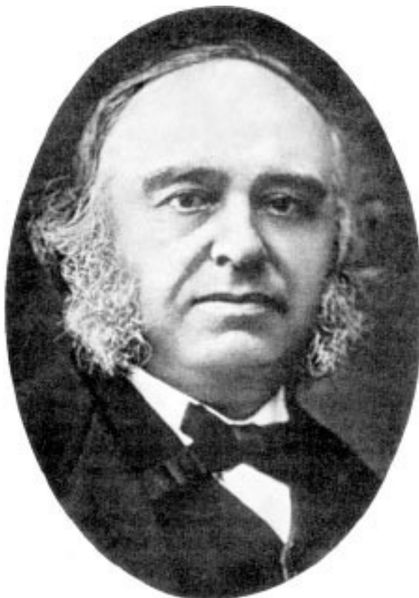
Рис. 2. Поль Брока (1824–1880).

Научный в современном понимании интерес к трепанациям древности возник только во второй половине XIX века, когда впервые совершались громкие археологические открытия. Сперва американский дипломат Е. Г. Сквайер нашел древний трепанированный череп в Перу и послал его на экспертизу крупнейшему специалисту того времени – французскому антропологу Полю Броку (Рис. 2, 3). Позже сенсационные находки были сделаны уже в самой Франции. Археологи раскопали несколько сотен трепанированных черепов и еще вырезанные из них пластинки, и не где-нибудь, а в слоях нового каменного века!