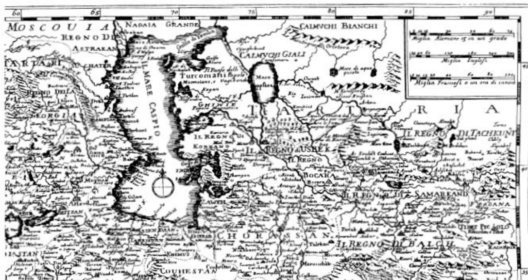
Рис. 1. На самом деле страна Тартария существовала – в представлении средневековых европейцев. И географическое положение этой загадочной страны в значительной мере совпало с территорией современной России. Это хорошо видно на карте, составленной в XVII веке Исаком Тирионом в Амстердаме и помещенной в пятом томе венецианского издания «Istoria

Нет на карте мира мистической страны Тартарии, так же как нет в природе бронированных медведей и многих других загадочных существ (Рис. 1). Но были в истории человечества таинственные цивилизации, описание обычаев которых может послужить сюжетом не для одного фантастического романа. История ушедших народов известна нам далеко не полностью. Изучая более близкие нам периоды, мы можем опираться на письменные источники. Но письменность – довольно позднее изобретение, и более ранние эпохи возможно постичь лишь производя археологические раскопки. С археологией тесно связана палеоантропология – наука о древнем человеке, представители которой посвящают свою жизнь изучению найденных при раскопках человеческих костей. Ее особая отрасль – палеопатология – изучает болезни древних людей (ведь многие заболевания возникли далеко не сразу) и архаические методы лечения. Научные занятия палеоантропологов и палеопатологов имеют непосредственное отношение к теме этой книги.