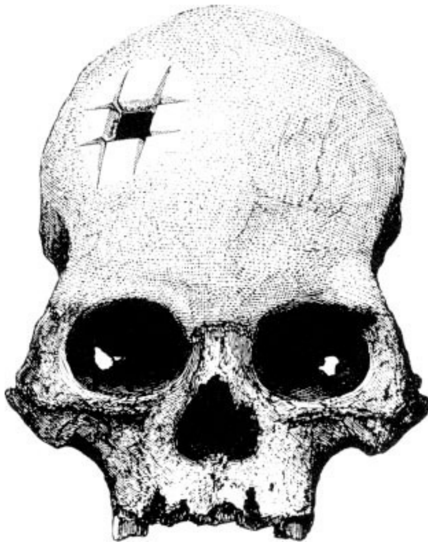
Рис. 3. Инкский череп из Куско, с которого началось исследование трепанаций древности.

«Я имею честь представить Академии древний перуанский череп, трепанированный при жизни субъекта способом полностью отличным от использовавшегося в европейской хирургии.