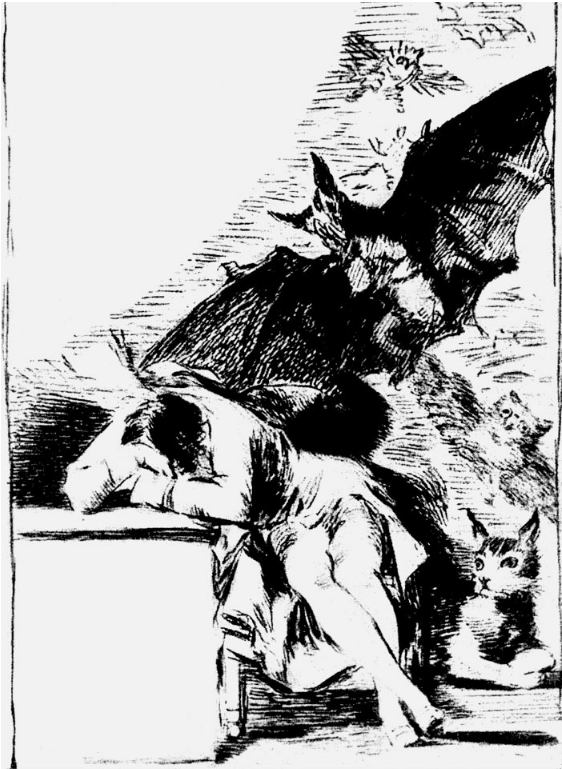
Рис. 4. Франсиско Гойя. «Сон разума рождает чудовищ». 1797–1799

Такая травма не только может стать причиной легких обратимых нарушений работы сердца и сосудов, но даже привести к смерти. При сильном страхе, который представляет собой, с точки зрения медицины, шоковую психическую травму, в кровь поступает большое количество катехоламинов, вызывающих остановку сердечной деятельности.