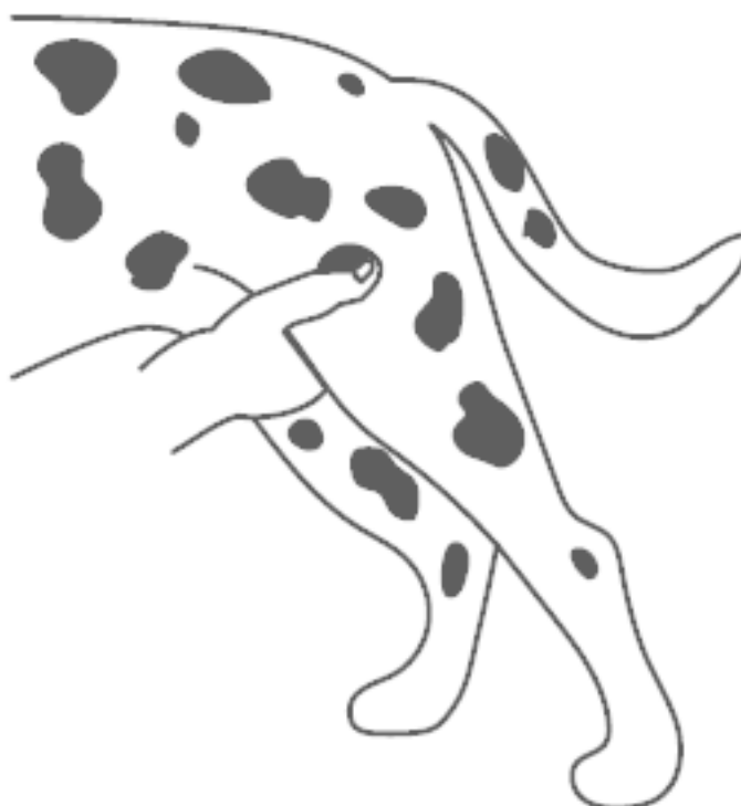
Рисунок 3. Как посчитать пульс

Чтобы узнать норму пульса для своего питомца, советуем вам сделать несколько измерений в состоянии покоя и вывести среднее значение.