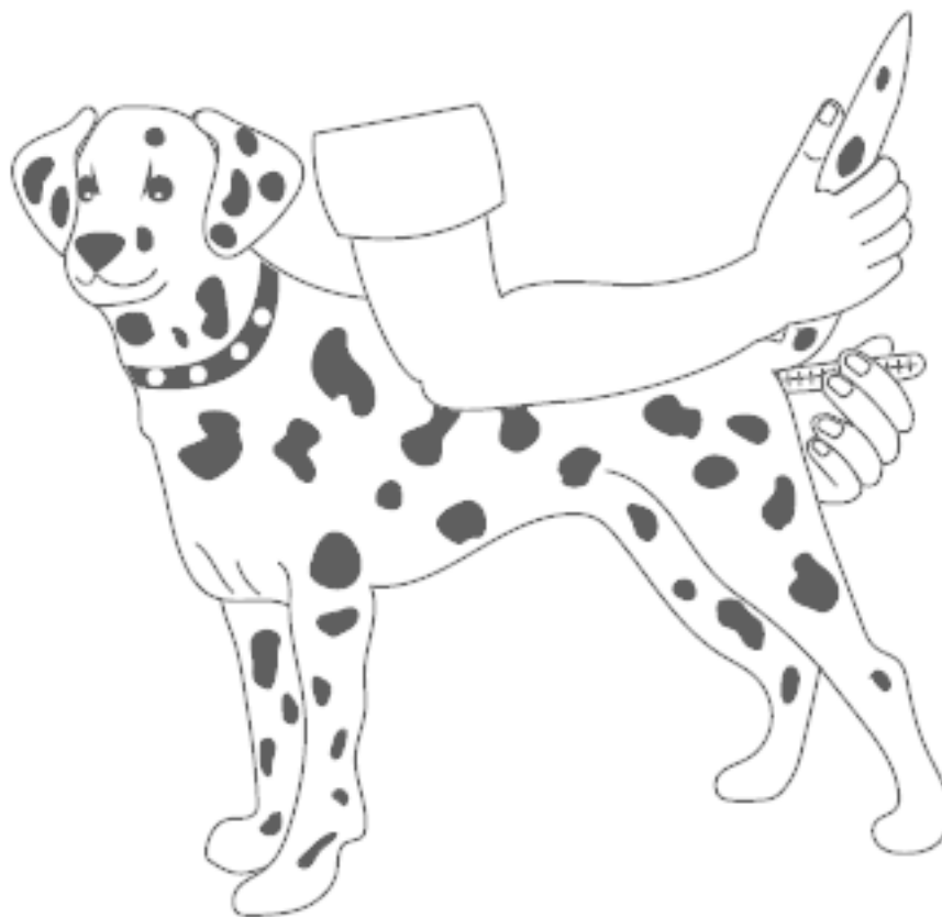
Рисунок 1. Измерение температуры у собак