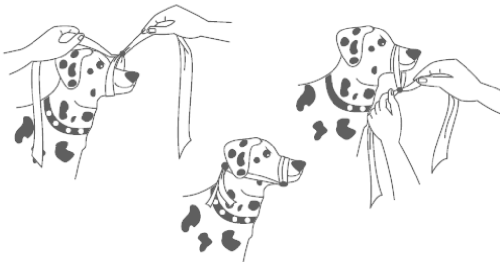
Рисунок 4. Импровизированный намордник

Поэтому сначала наденьте на пострадавшую собаку намордник или завяжите ей пасть, как показано на схеме.