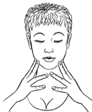
Рис. к упр. 1

начиная с середины подбородка, и продолжите по всей линии челюсти. Закончите легкими круговыми движениями в области щек. Повторяйте каждое движение в течение одной минуты.