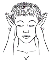
Рис. к упр. 6

Упражнение выполнять в течение двух минут.