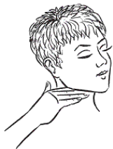
Рис. к упр. 4

4. «Держите рот на замке» (помогает укрепить обвисшие мускулы подбородка). Сядьте прямо и с помощью тыльной стороны ладони совершайте легкие, но уверенные постукивания по нижней стороне челюсти. Повторяйте на протяжении тридцати секунд.