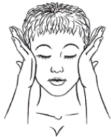
Рис. к упр. 6

7. и 8. «Малышка хмурится» и «Львенок» (стимулируют циркуляцию и снимают напряжение). Для первого упражнения сильно нахмурьтесь: совсем закройте глаза, сожмите губы, напрягите подбородок. Сосчитайте до пяти, затем переходите к упражнению «Львенок». Выдохните как можно сильнее, расслабьте все мускулы и громко выкрикните, высунав язык как можно дальше.