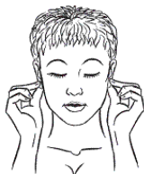
Рис. к упр. 5

краю с помощью указательного и большого пальцев рук. Когда дойдете до мочки, нажмите на нее и подержите несколько секунд. Повторять на протяжении одной минуты.