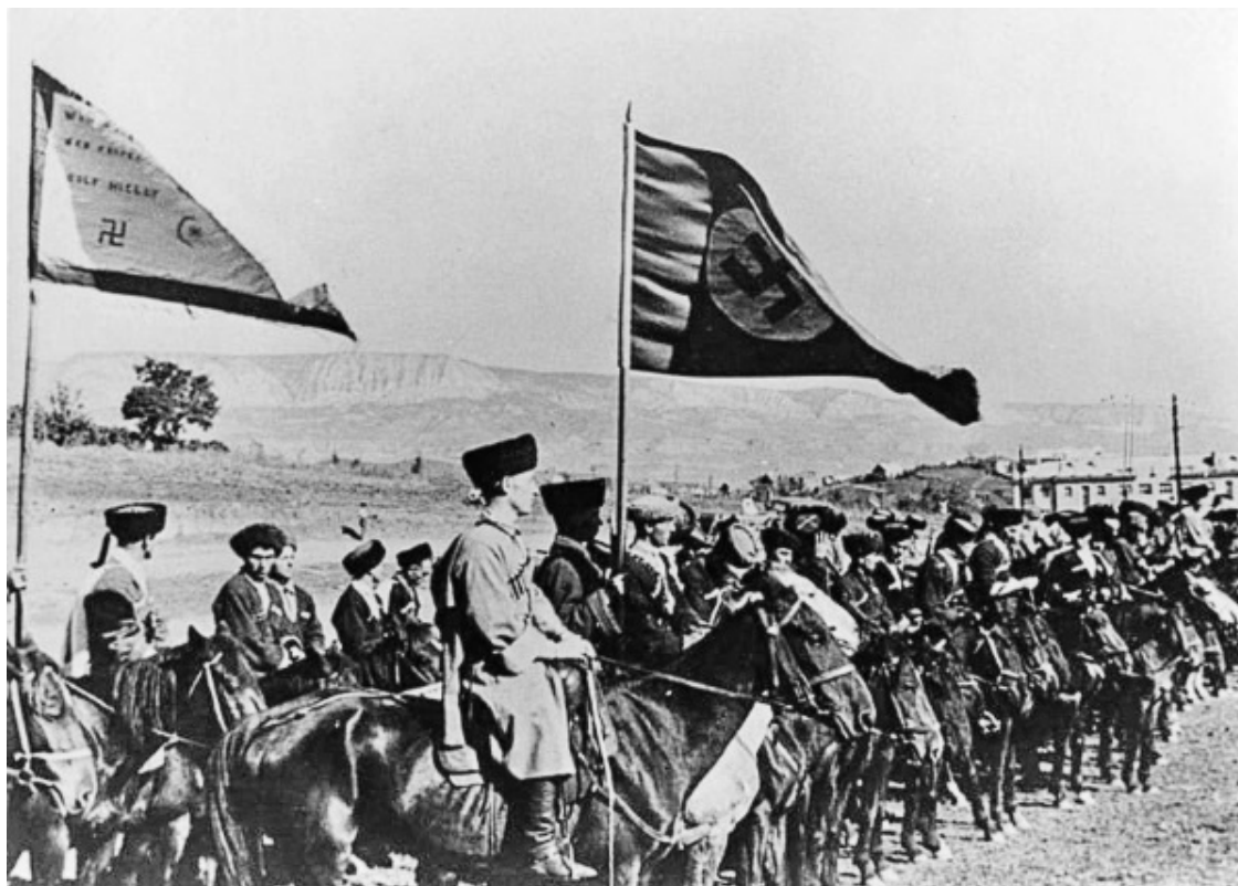
Казачья дивизия вермахта

Гитлер в резкой форме отказался обсуждать автономию для России и русских. Иным было отношение к казакам. Их освобождали из плена, в казачьих станицах не устраивали репрессий. Из пленных казаков начали формировать кавалерийские полки. Летом 1942 года офицер немецкой разведки Филипп Юх прибыл на Кубань для формирования 1-й казачьей дивизии. Вот что он помнит: «Я поступил на службу в 4-й кубанский полк. Я горжусь, что служил именно в этом полку. Потому что там, среди казаков, была поистине удивительная атмосфера. Я помню, как мы вместе с казаками уходили из станицы. Казаки шли вместе с вермахтом».