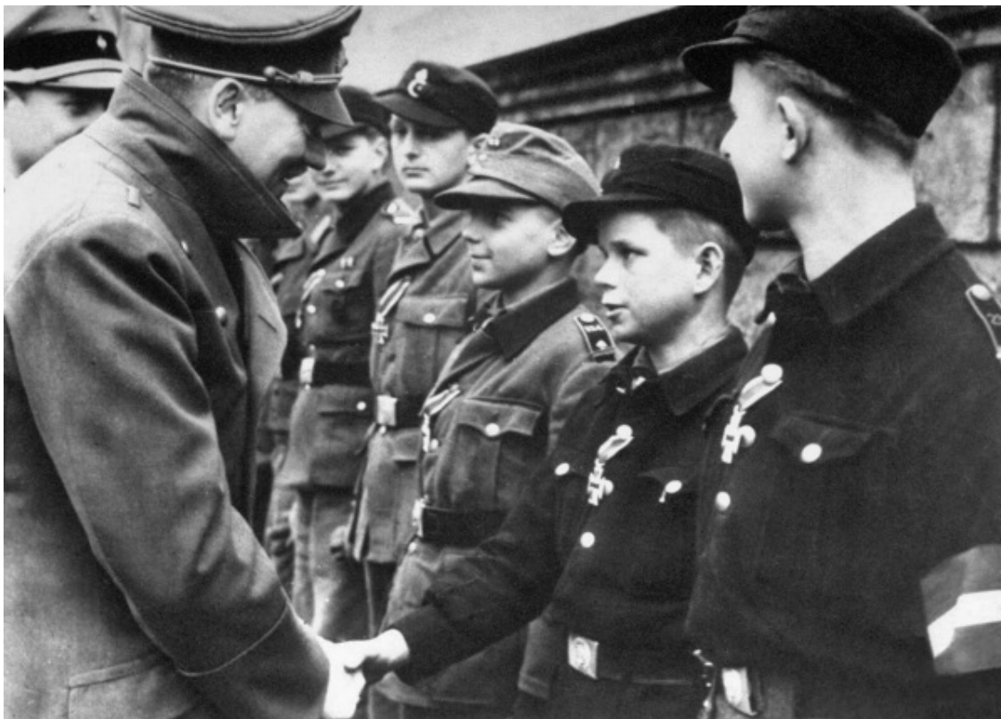
Гитлер пожимает руки воспитанникам «гитлерюгенда»

Еще в 1930-е появились первые школы организации юных гитлеровцев – «гитлерюгенда». Здесь должны были расти сильные, выносливые и преданные делу фюрера солдаты. Турпоходы и спортивные состязания постепенно переходили в военное учение, а солдатские френчи заменяли становившуюся тесной униформу «гитлерюгенда». Германии нужны солдаты, которые будут убивать каждого, кто встанет на пути великого рейха.