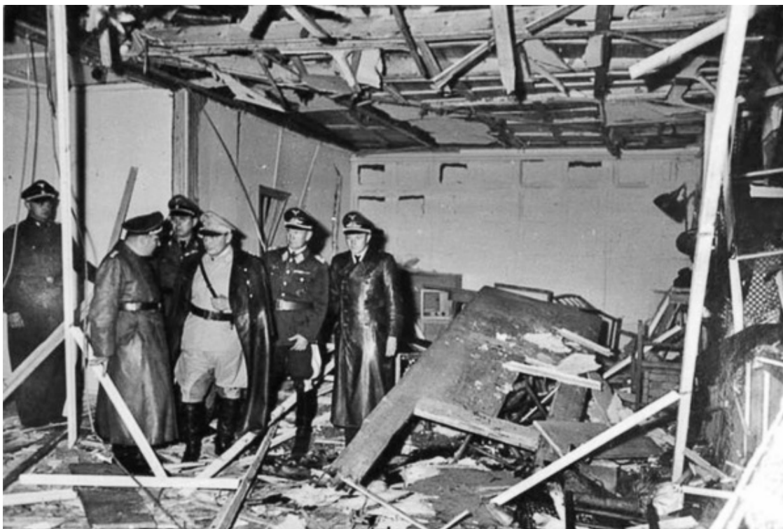
Последствия взрыва в «Волчьем логове» Гитлера