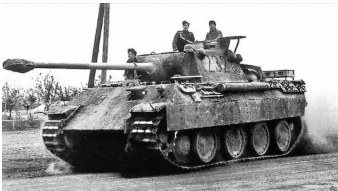
Немецкий танк «Пантера»

Линия фронта протянулась от Баренцева до Азовского моря, в районе Курска огромным выступом протяженностью 550 километров угрожающе вдавилась в расположение немецких войск. Это и есть та самая Курская дуга, где лоб в лоб должны были столкнуться главные наступательные силы вермахта и Красной армии. Почти 2 000 000 солдат, тысячи орудий, самолетов и танков изготовились на направлении главного удара в напряженном ожидании схватки.