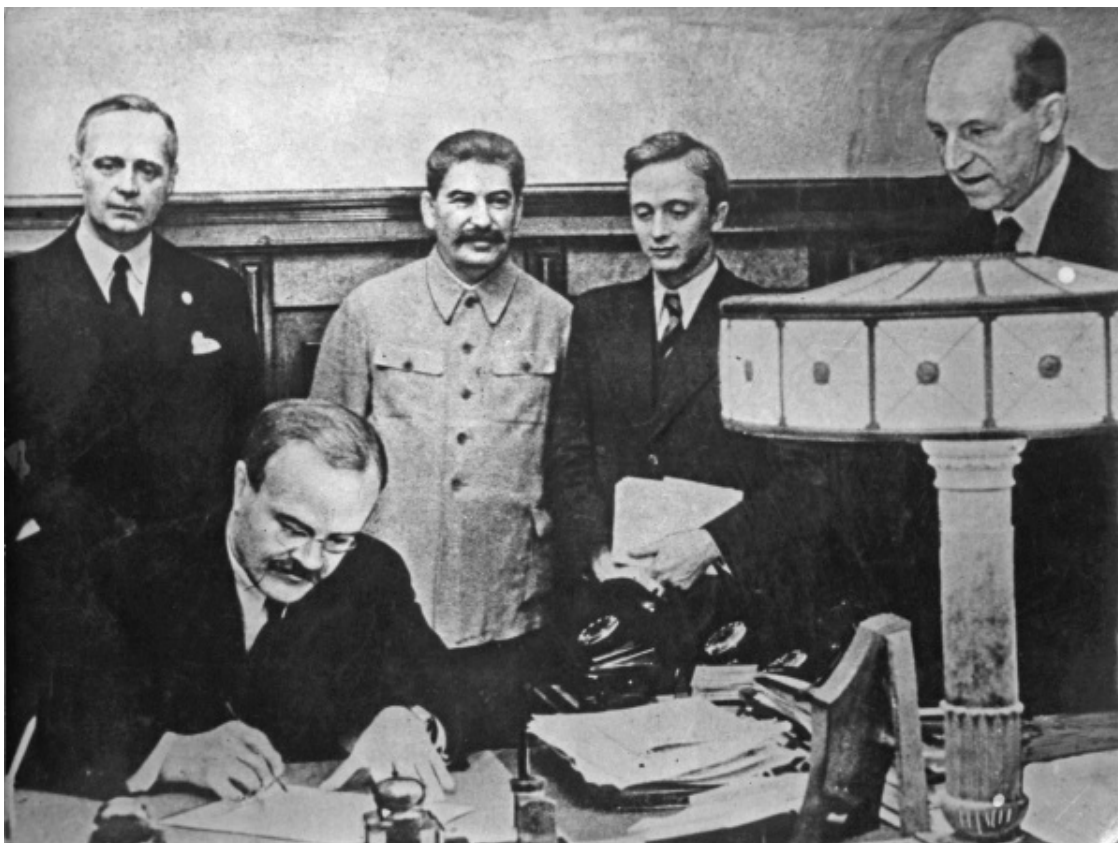
Подписание пакта Молотовым и Риббентропом

Небольшой приграничный город Белосток. Апрель 1941-го. Прошло уже почти два года с того самого дня, как немцы оккупировали Польшу, и потому тревога не покидает улочки городка. Люди запасаются мукой, солью, керосином. И готовятся к военному времени. Народ ничего не понимает в больших политических играх Советского Союза и Германии, но по вечерам все слушают новости из Москвы.