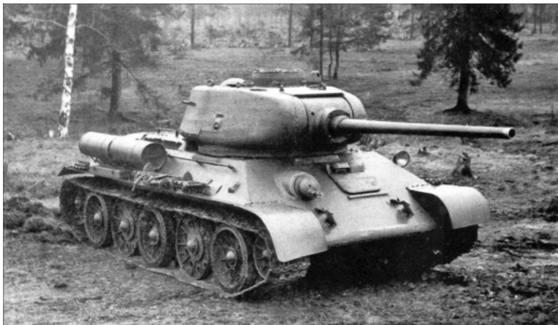
«Т-34» – гордость советского танкостроения

12 июля на Прохоровском поле разгорелась настоящая танковая сеча. До позднего вечера слышался несмолкаемый гул моторов и лязг гусениц. То и дело танковые башни взлетали в воздух от прямых попаданий, их отбрасывало буквально на десятки метров. Из-за дыма и гари уже невозможно было отличить своих от чужих. Горели сотни танков и самоходных орудий. Прохоровское поле превратилось в гигантское кладбище бронетехники.