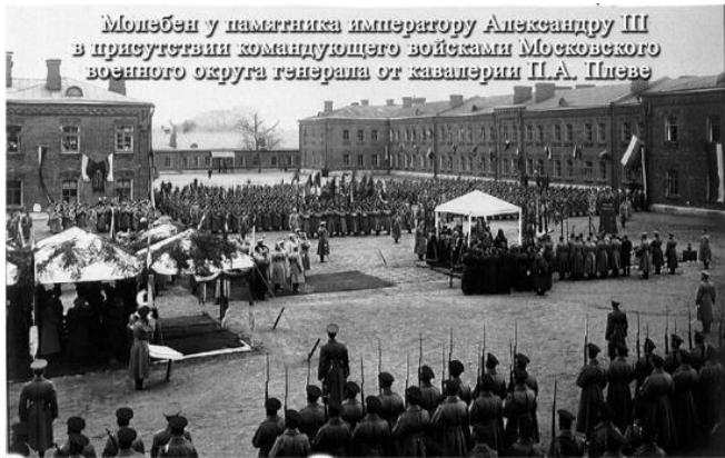
Молебен у памятника императору Александру III в присутствии командующего войсками Московского военного округа генерала от кавалерии П.А. Плева

Улица, известная нам как Волочаевская, когда-то называлась Золоторожской (от ручья Золотой рожок), а после 1919 года стала называться Бухаринской (по имени революционера). Нынешнее свое название улица получила в 30-е годы прошлого века в память о сражении у дальневосточного села Волочаевка в 1922 году.