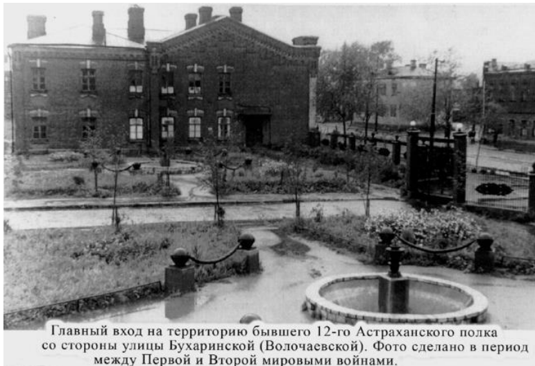
Главный вход на территорию бывшего 12-го Астраханского полка со стороны улицы Бухаринской (Волочаевской). Фото сделано в период между Первой и Второй мировыми войнами.