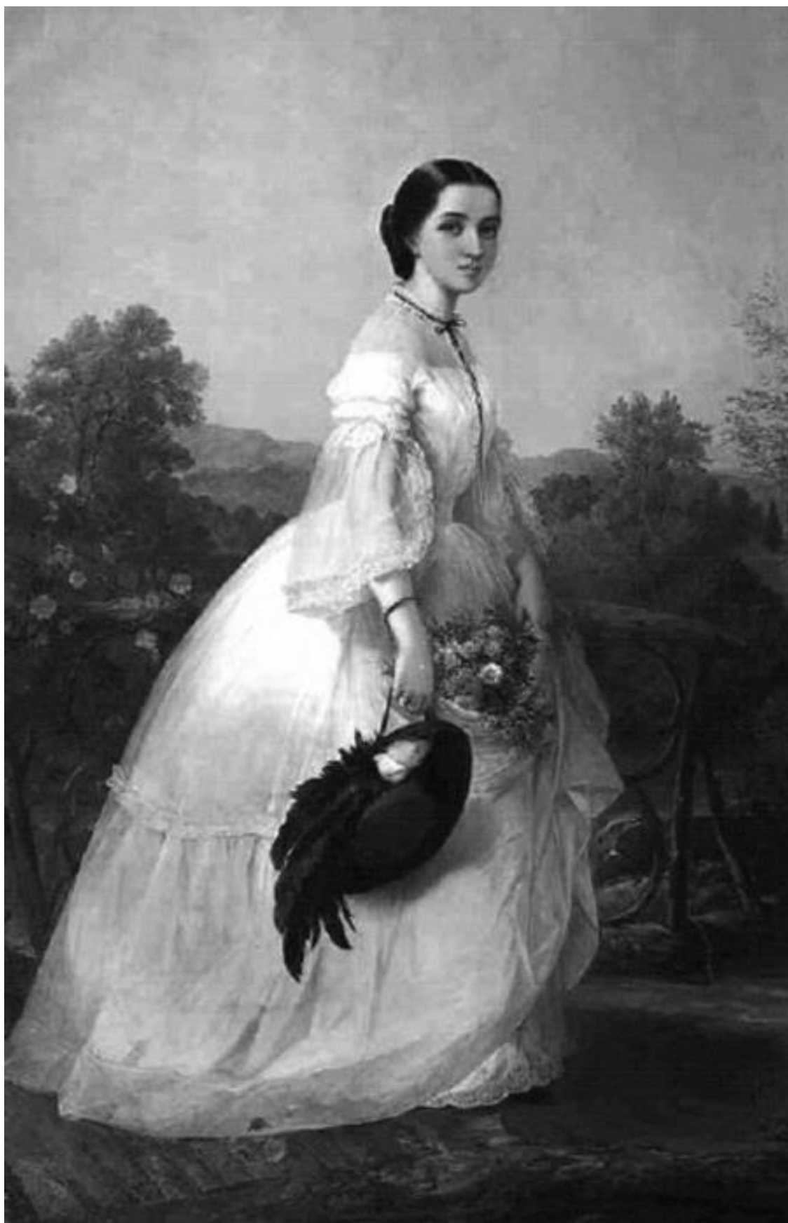
Йенни Линд. Художник Л. Ланг