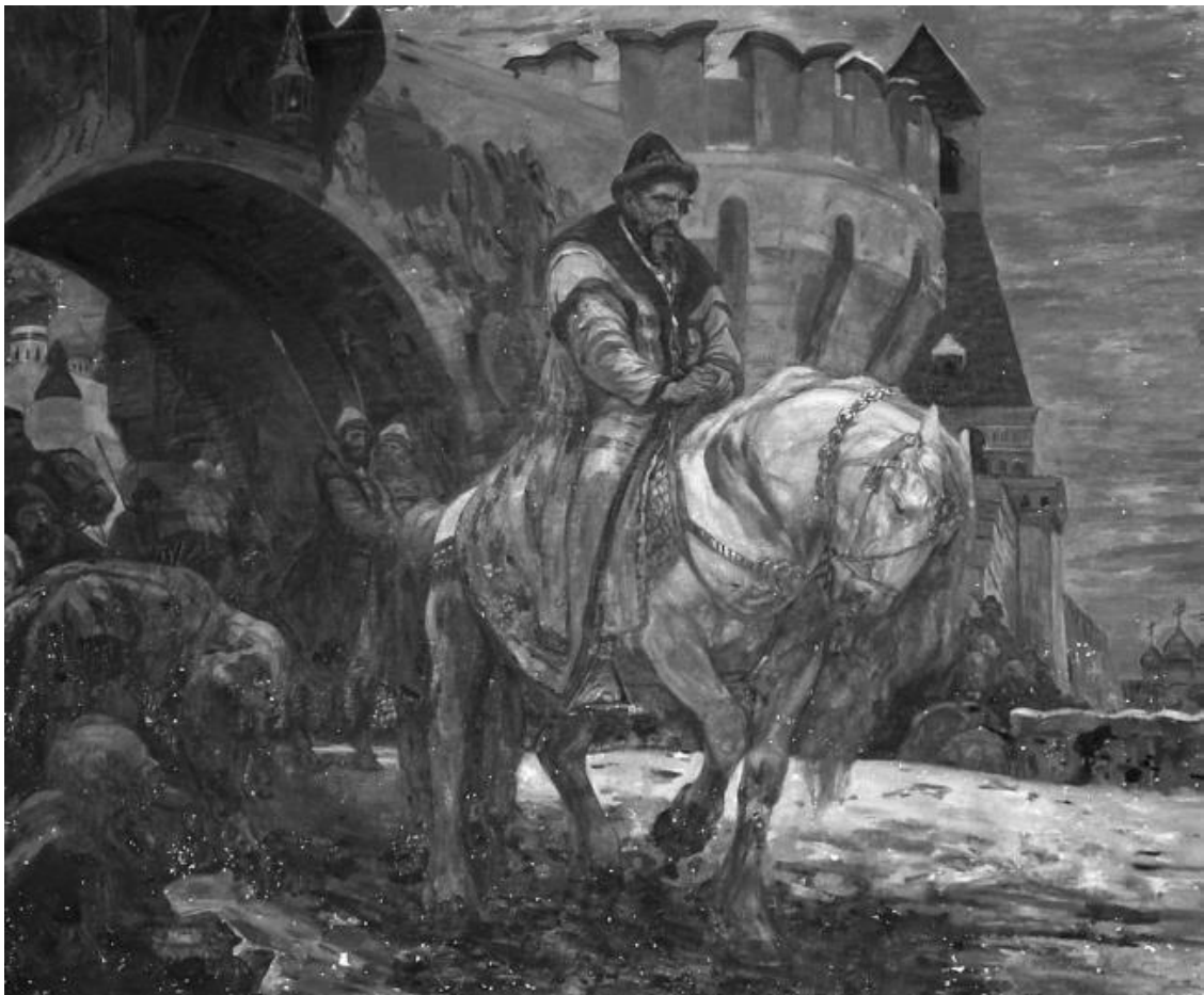
Тайный выезд Ивана Грозного перед опричниной.

В положенный срок у женщины родился мальчик, названный Георгием. Разумеется, Василию III доложили о неожиданном наследнике. В гневе князь наложил опалу на интриганов, оклеветавших его теперь уже бывшую супругу. Но дела обратно не поворотить, и Василий III женился во второй раз на юной девочке Елене Глинской, ведущей свой род из литовских бояр. Вскоре у пары появился сын, ставший известным на весь мир под именем Ивана IV, или Ивана Грозного.