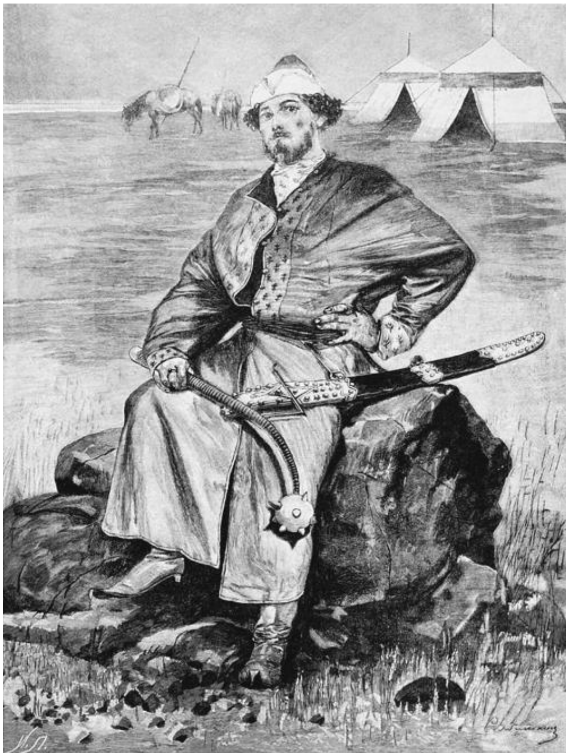
Алеша Попович. Художник А.П. Рябушкин

Говоря о реальных ратных подвигах этого воина, можно отметить, что все они связаны с затяжной войной за владимирский престол между братьями Константином Всеволодовичем и Юрием Всеволодовичем, начавшейся после смерти Всеволода Большое Гнездо. Победу в противостоянии одержал князь Константин Всеволодович, поддерживаемый Александром Поповичем. Но вскоре он умер, и владимирский престол отошел к князю Юрию Всеволодовичу. Очевидно, опасаясь княжеского гнева, Александр Попович со своими товарищами по оружию спешно уехал из Владимира.