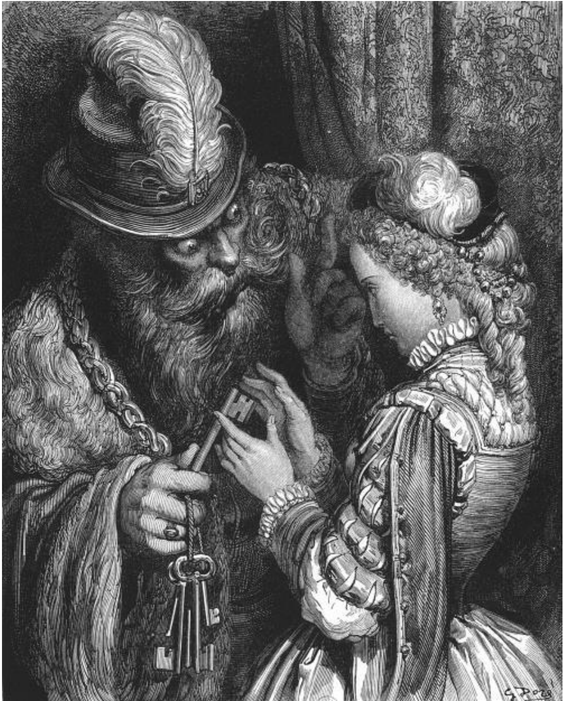
Синяя Борода, жена и ключ. Художник Г. Доре

В конце XVIII века во Франции, в собственном замке Гийет, коротал свои дни богатый и знатный, но одинокий дворянин. Нрава он был самого добродушного и, к огорчению своей многочисленной родни, не делал большого различия между богатыми и бедными, знатными и простыми людьми. Несмотря на все свое богатство и мужскую привлекательность, в отношениях с женщинами Монрагу был скромн и очень боязлив. Словно чувствуя безотказный нрав доброго хозяина замка, к нему тянулись женщины с сильным характером, с авантюрными наклонностями. Однажды, повергнув всех своих родственников в шок, Монрагу женился на... цыганке, выступающей на ярмарках с дрессированным медведем. Впрочем, неравный брак вскоре распался. Цыганка, не выдержав жизни в «золотой клетке», сбежала на свободу,