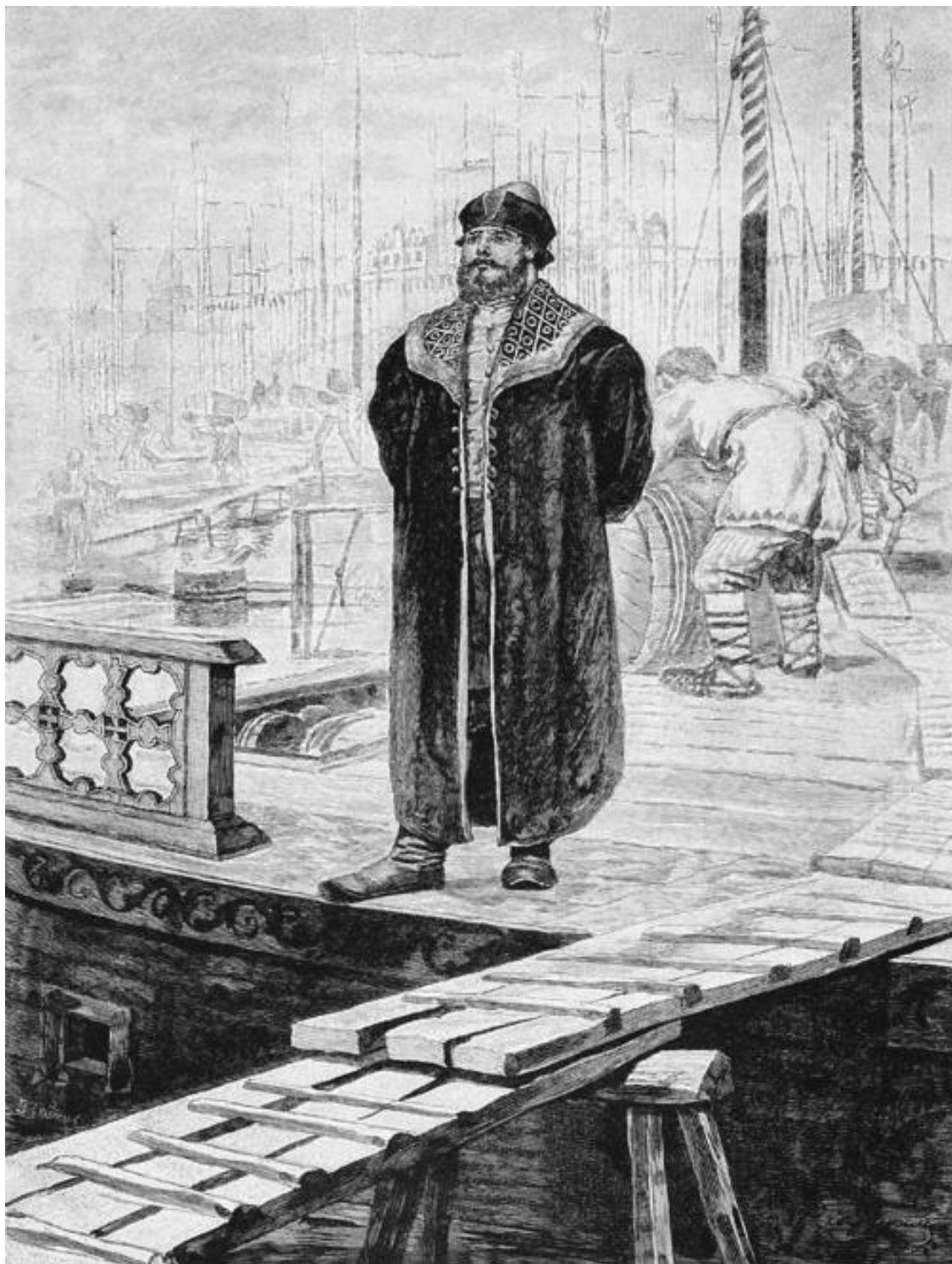
Садко, богатый новгородский гость. Художник А.П. Рябушкин

На основании дошедших до нашего времени летописей, большинство историков склоняются к версии, что прообразом Садко мог являться человек по имени Сотко Сытинец. Старинная песня о его жизни могла быть взята за основу и переложена в сказание о гуляре Садко. В тексте музыкального произведения говорилось, что Сотко построил в Новгородском кремле каменную церковь в честь святых мучеников Бориса и Глеба в 1167 году в знак благодарности за своё чудесное спасение на море. Причем интересно отметить, что церковь была настолько большой и величественной, что не уступала по размерам Софийскому собору, что может гово-