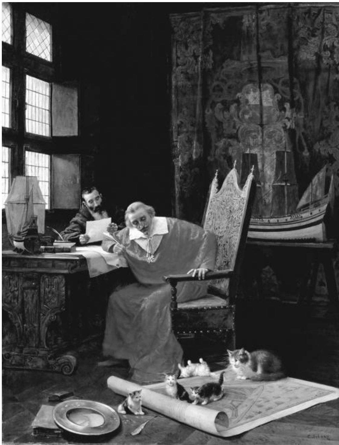
Ришелье и его кошки. Художник Ш.-Э. Дело

Но самым необычным оказался крупный черный кот Люцифер. Исторические легенды утверждают, что этот кот помогал другим кошкам, подвергавшимся гонениям во Франции, пробираться на борт кораблей, отплывавших в Новый Свет. Правда, каким образом он это делал, остается загадкой. Зная о любви знаменитого кардинала к кошкам, Шарль Перро, живший в то же время, посвятил кардиналу свою популярную сказку, о чем впоследствии не раз упоминал в своих мемуарах.