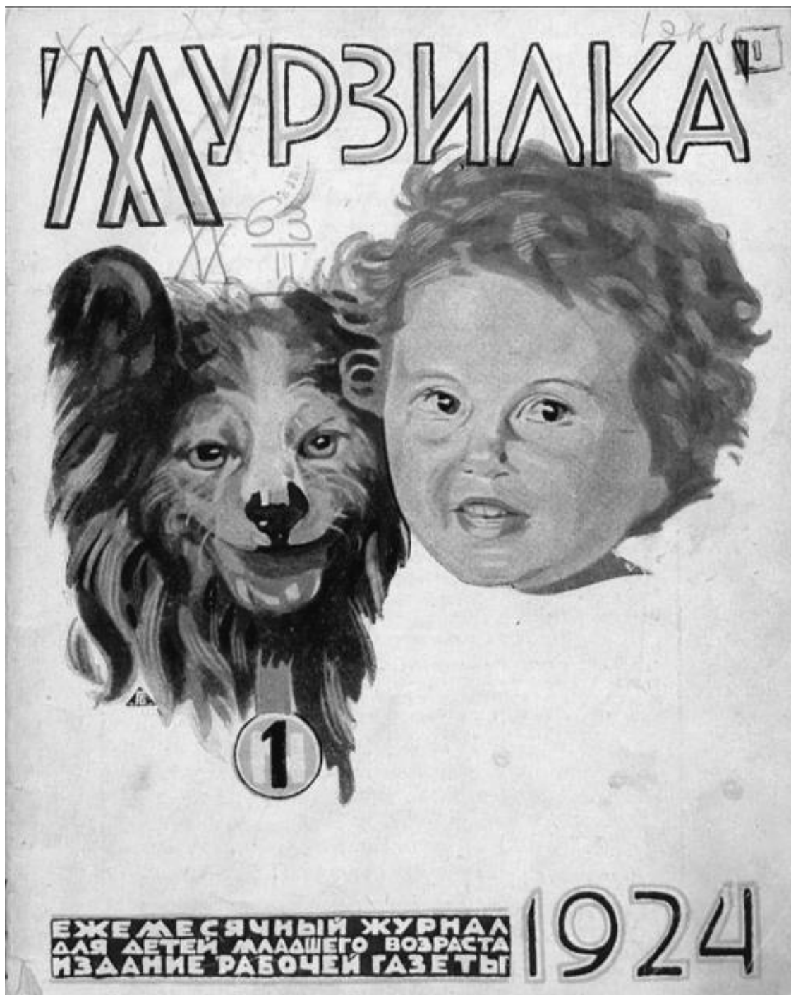
Обложка журнала «Мурзилка». 1924 г.