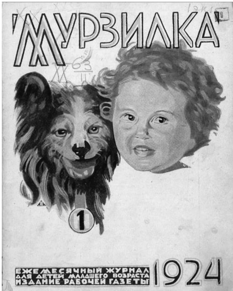
Обложка журнала «Мурзилка». 1924 г.