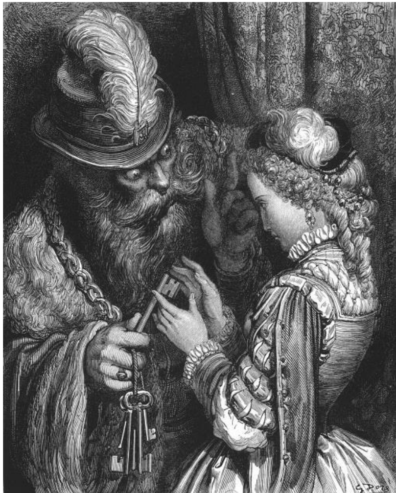
Синяя Борода, жена и ключ. Художник Г. Доре