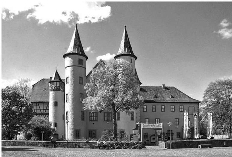
Замок-музей в городе Лор-на-Майне

мов низкорослых мужчин было довольно сложно. От своего нелегкого труда в глубоких темных подземельях рудокопы выглядели низкорослыми, раньше срока сторбленными людьми. Сюжет сказки повторился практически полностью. Правда, в реальной жизни злая мачеха так и не нашла свою падчерицу.