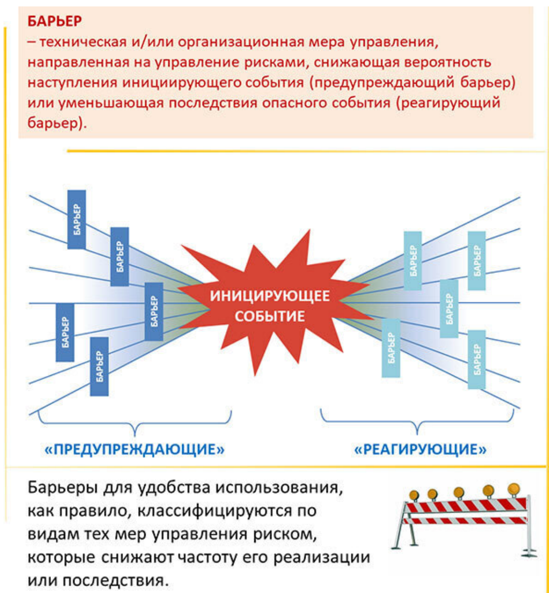
Рис. 2.2. Основные сведения по термину «БАРЬЕР»

Опыт показывает, что все предупреждающие и реагирующие барьеры можно систематизировать по группам. Один из вариантов классификации барьеров по группам или видам 4 (его аналоги применяются в некоторых нефтегазовых компаниях) показан на рисунке 2.3.