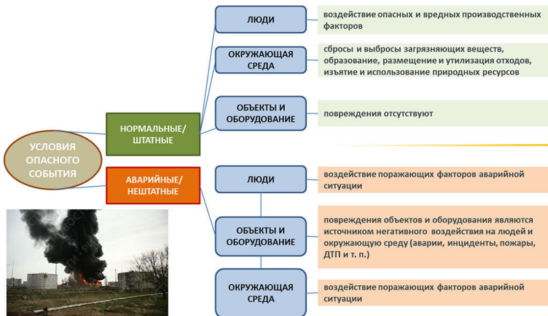
Рис. 2.4. Примеры определения условий опасного события

Примеры определения условий опасного события показаны на рисунке 2.4.