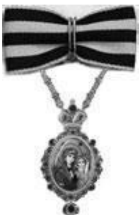
Священнослужители, пожалованные панагией на Георгиевской ленте