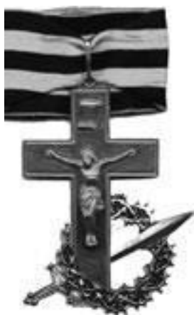
Священнослужители, пожалованные наперсным крестом на Георгиевской ленте в Белых армиях