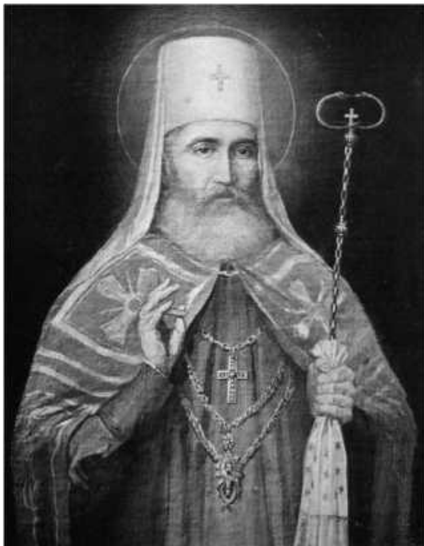
Петр I Петрович Негош (1748–1830) (Свт. Петр Цетинский)

Имя Петра I Петровича Негоша уже упоминалось нами. Поскольку в России этот святой, прославленный церковью как святитель Петр Путинский, известен не столь широко, как в Черногории, где его знает буквально каждый, необходимо посвятить хотя бы несколько слов этой ключевой фигуре в истории отношений России с Балканами.