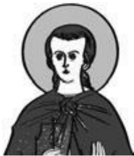
Священнослужители, прославленные в лике святых