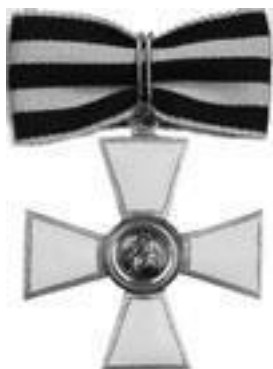
Священнослужители, пожалованные орденом св. Георгия 4-й ст.