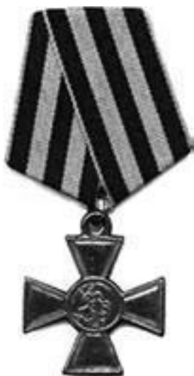
Священнослужители, пожалованные Георгиевским крестом (Знаком отличия Военного ордена)