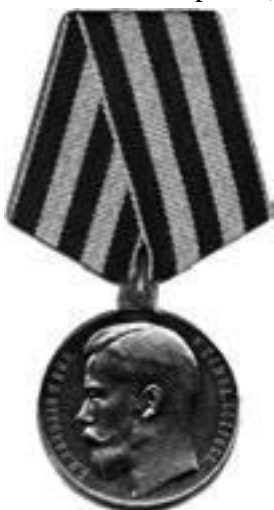
Священнослужители, пожалованные Георгиевской медалью «За храбрость»