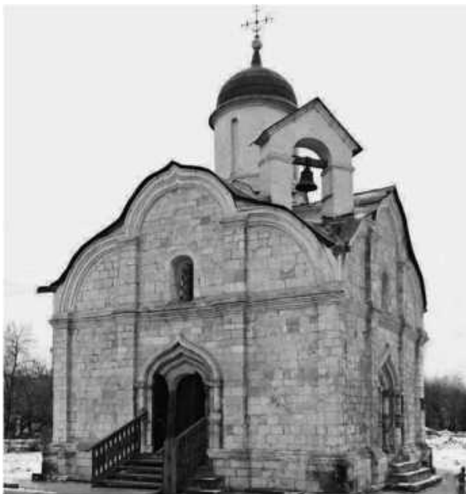
Церковь св. Трифона в Напрудном