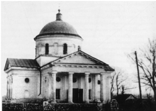
Покровская церковь в Петровке. Фотография 1920-х годов