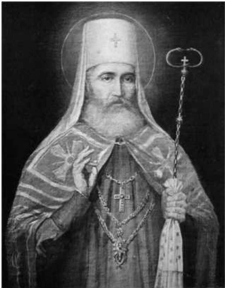
Петр I Петрович Негош (1748–1830)