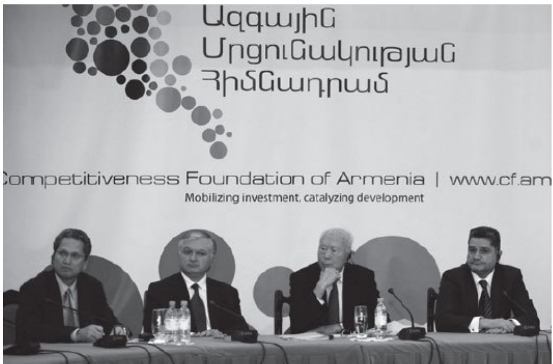
Визит в Армению в сентябре 2009 года