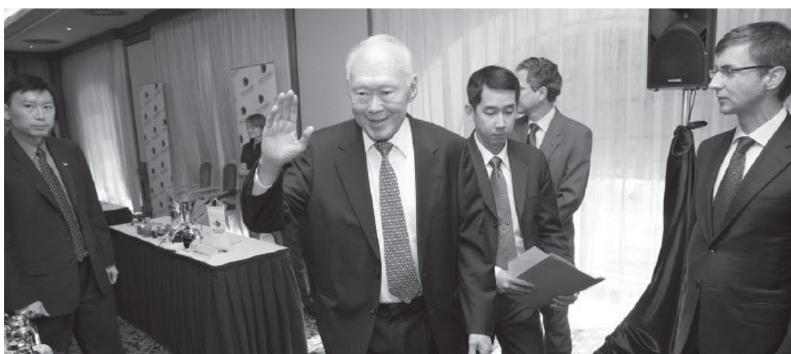
Встречи в Московской школе управления СКОЛКОВО в 2007–2010 годах

Ли Куан Ю – удивительный человек, обладающий Видением и Волей. Именно эти качества позволили в 1959 году молодому юристу, выпускнику Кембриджа, сначала победить на выборах, а затем добиться независимости Сингапура от Малайзии и совершить то самое экономическое чудо, превратив небольшой остров без природных ресурсов, с постоянно растущим населением и слабой экономикой в процветающий город-государство.