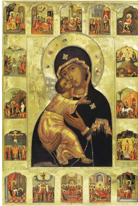
Владимирская икона Божией Матери

К Ее лику, смотрящему с улыбкой услады или тихой грустью на приходящих к Ней, бегут малые дети, шепча свои несложные желания, доверяя свои заботы и делишки. Женское сердце, переполненное счастьем разделенной любви или страдающее мукой любви, – к Ней же, не знавшей иной любви, как поклонение Своему Иисусу, – несет свою радость и печаль, Ей рассказывает свои надежды и мечты. Строгий затворник, уединяясь от людей в подземной пещере, куда никогда не проникает свет солнца, ставит у себя Ее икону с неугасимой лампадой, и Пречистая Дева Мария одна заменяет ему все те радости и утехи, которых он себя добровольно лишил.