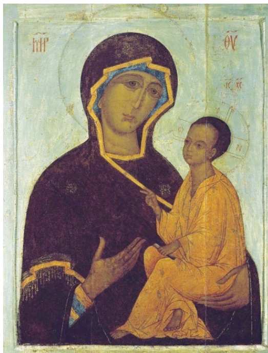
Тихвинская икона Божией Матери. XVI в.