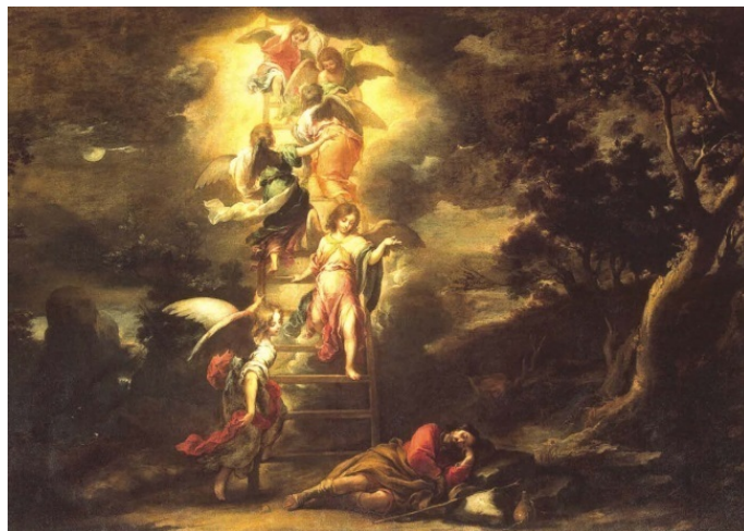
Сон Иакова. Бартоломео Эстебан Мурильо

На пространстве ветхозаветных веков один за другим являлись пророки, предвозвещавшие о таинственной Деве и, бросив такой луч надежды страдающему человечеству, сами отходили в безотрадное царство теней. Не останавливаясь на этих пророчествах, вспомним о тех внешних, живых прообразах, в каких Бог обетовал о Пречистой Деве Матери.