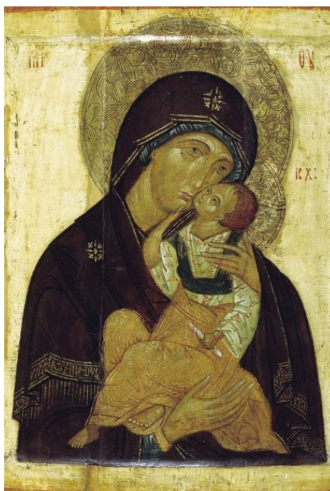
Яхромская икона Божией Матери. XV в.

В иконах Богоматери верующие люди, их писавшие, отразили Пречистую Деву в разные минуты духовной Ее жизни.