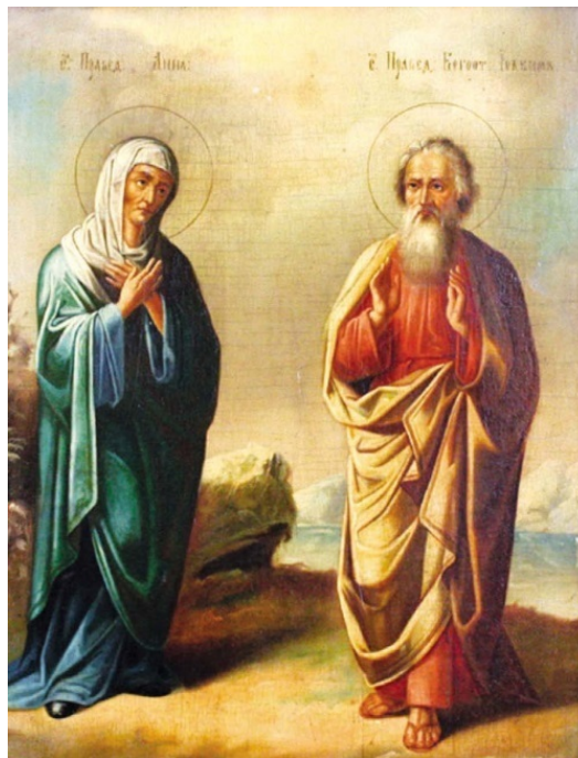
Святые праведные Иоаким и Анна.

И плещущие воды половодья, омывающие прибрежные луга, обеспечивая богатый сбор покоса, и тихо-торжественно разгорающаяся на горизонте заря, и звезда, утренняя провозвестница солнца, – все это символы Той, Которая обняла, обхватила Собой всю жизнь человеческую.