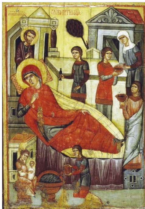
Рождество Богородицы. Икона. Середина XIV в.

Еще через год Иоаким думал исполнить над Мариею обет посвящения Ее Богу, но Анна, боясь, что в храме дитя соскучится по дому, и желая по материнской нежности дольше удерживать Ее при себе, уговорила мужа отсрочить на один год его намерение.