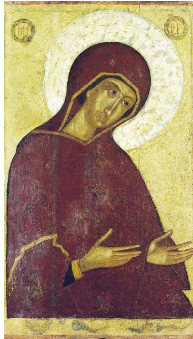
Икона Божией Матери из деисисного чина. 1-я пол. XV в.

Если жизнь человеческая представляется страшным полем, где в безумной борьбе между собою валяются люди, где гибнут мечты, надежды, где звучат нескончаемые вопли и стоны, то над этим житейским адом царит одно отрадное видение. Чудная Дева Небесная с безграничной скорбью и любовью во взоре, с ланитами, по которым стекают жемчужины слез, стоит над этим морем людского страдания, спускаясь туда, где оно особенно ожесточилось. Не в силах Она изменить лица земли, водворить рай на месте земной каторги. Но, приникая к настрадавшейся, обезумевшей, отчаявшейся душе человеческой, как склонялась некогда над Своим Божественным Младенцем, Она шепчет душе верную весть о лучших днях... Как мать, Она знает подходы к сердцу человеческому, и под Ее безмолвную речь ослабевшая, одряхлевшая вера становится живым видением и ясным предчувствием.