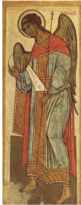
Архангел Михаил. Икона из деисисного чина

Пусть двери рая заключены, охраняемы Архангелом с огненным мечом. Там, за далью многих десятков веков, маячит лучезарный спасительный образ. Непорочная Дева Матерь, после неимоверного страдания приняв в человеческую душу Свою крестную муку сладчайшего Своего Иисуса и в этот час выстрадав право на материнство всего усыновленного Ей с Креста человечества, подойдет к этим заключенным дверям; и дрогнет защищающая их рука Архангела пред Матерью Бога, и отступит он от заветных заключенных дверей, и тихо подойдет к ним Дева, и тихо распахнет их пред Ею усыновленным и Ею выстрадавшим человечеством.