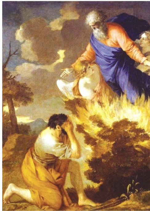
Неопалимая купина. С. Бурдон

«Лествица», которую видел во сне Иаков, знаменовала собою Ту, Которая явилась связью между умиловившимся небом и прощенной землей; Которая была как бы землей, на небеса вознесшеюся, и небом, к земле приникшим; Которая имела в Себе все человеческое, кроме греха, и все небесное, кроме Божественной сущности; Которая возвысилась до облагодатствованного состояния первого богоподобного человека, даже отдаленной мыслию не познавшего в себе зла, и поэтому беспрепятственным порывом могла взойти к небу, куда повела с Собою и никогда Ею не забытый род людской.