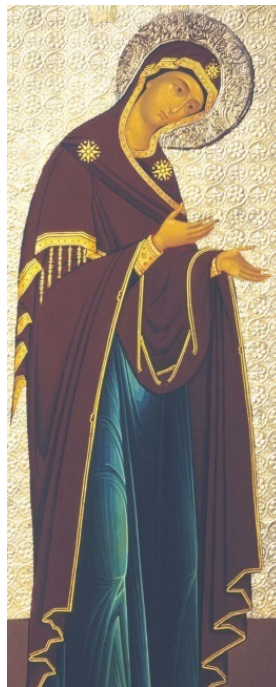
Пресвятая Богородица. Икона из деисисного чина

Когда дух-искуситель соблазнил первого человека и вывел его из повиновения Боже-ству, Бог произнес искусителю следующее таинственное пророчество: Вражду положу между тобою и между женою, и между семенем твоим и между семенем ее; оно будет поражать тебя в голову, а ты будешь жалить его в пята (Быт. 3, 15).