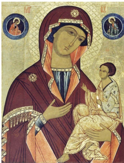
Грузинская икона Божией Матери. XVI в

Магометане, язычники знают о любви и вере христиан к таинственной Деве, и когда Царица Небес вставала на защиту Своих детей, они не пытались бороться с Ней, зная, что сила Пресвятой Девы Марии необорима.