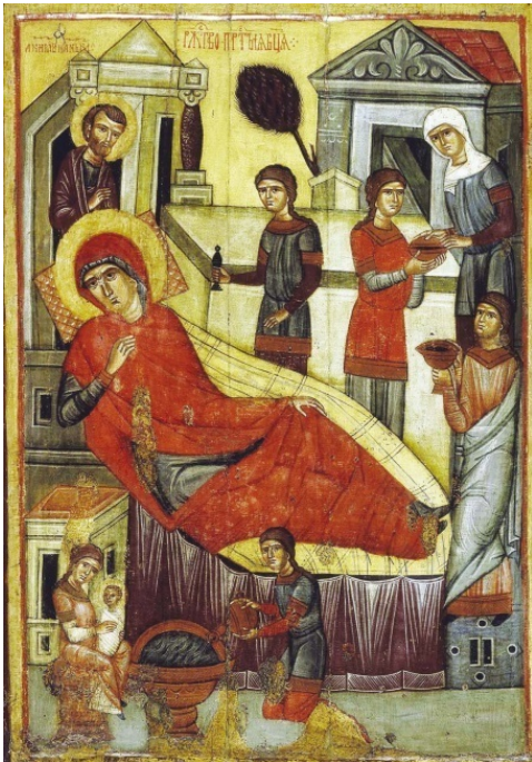
Рождество Богородицы. Икона. Середина XIV в.

Всего трех лет от роду Пресвятая Дева была введена во храм Иерусалимский. При храме в то время проживали мужи и жены – из вдов и девиц, ведущие чистый, благочестивый образ жизни. Это был как бы первообраз будущих христианских иноков.