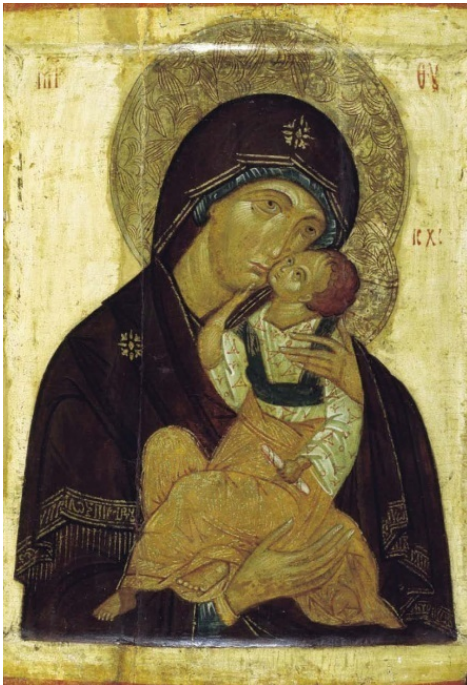
Яхромская икона Божией Матери. XV в.

В иконах Богородицы верующие люди, их писавшие, отразили Пречистую Деву в разные минуты духовной Ее жизни. Вот Она с тоскою взирает на Крест Своего Сына («Ахтырская»). Вот прижимает нежно обеими руками к щеке головку Младенца («Касперовская»). Вот, держа правой рукой Младенца, левую в скорби прижимает к голове – обычное положение тяжело страдающих людей («Утоли моя печали»).