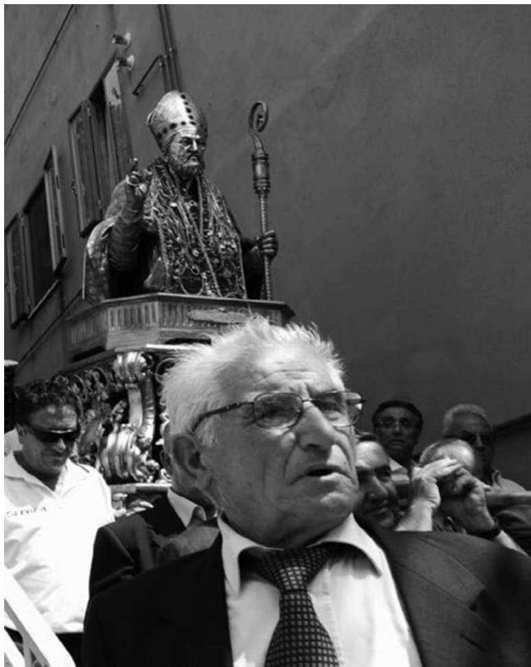
Процессия во время престольного праздника со статуей Св. Эгидия. Фото 2013 г.