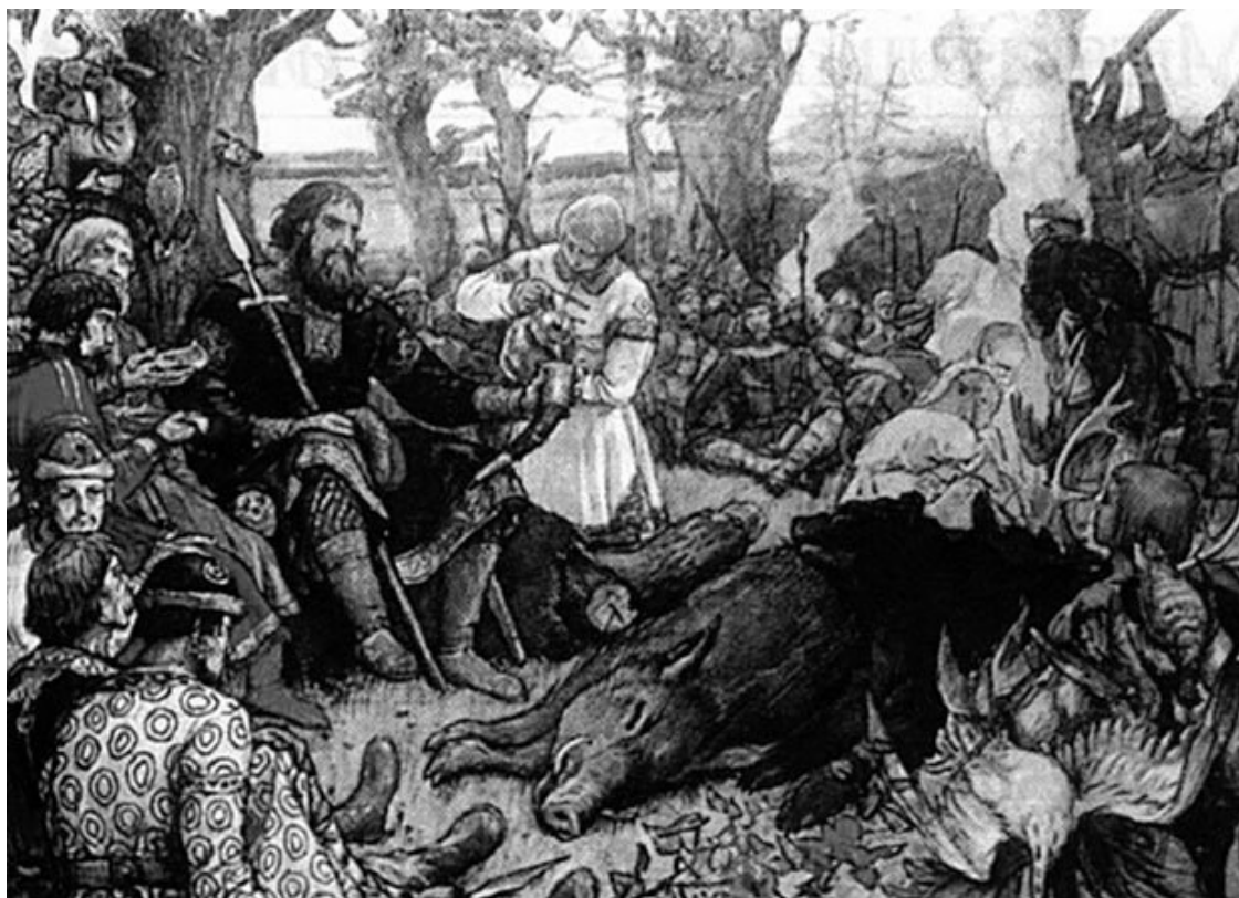
Отдых великого князя Владимира Мономаха после охоты. Художник В. М. Васнецов

Достойным началом княжения Мономаха стало перенесение 2 мая 1115 г. святых мощей Бориса и Глеба, сыновей великого князя Владимира Красное Солнышко (960–1015), из полуразрушенной деревянной церкви в новый каменный храм в Вышгороде. Это событие имело для русского народа огромное значение.