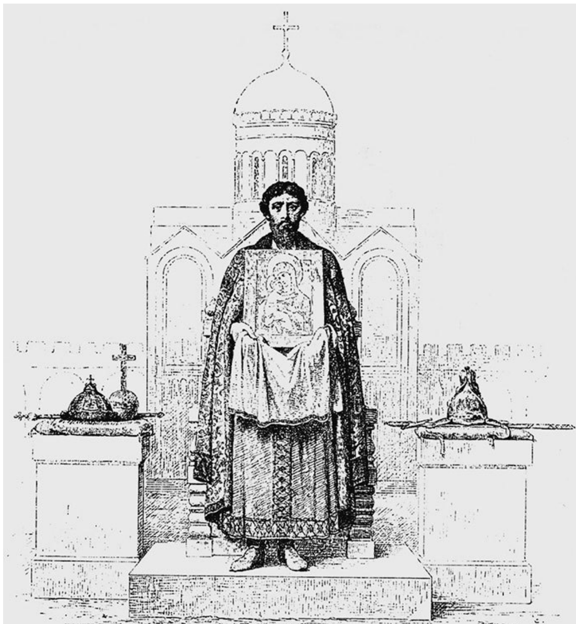
Святой князь страстотерпец Андрей Боголюбский

Его боевая удаля была примером для дружины. Андрей всегда был в самой гуще битвы. Он мог не заметить сбитого с головы шлема и продолжать разить противника направо и налево. Летописец отмечает редкое умение князя усмирять после сражения свой воинственный пыл и сразу превращаться в осторожного и благоразумного политика.