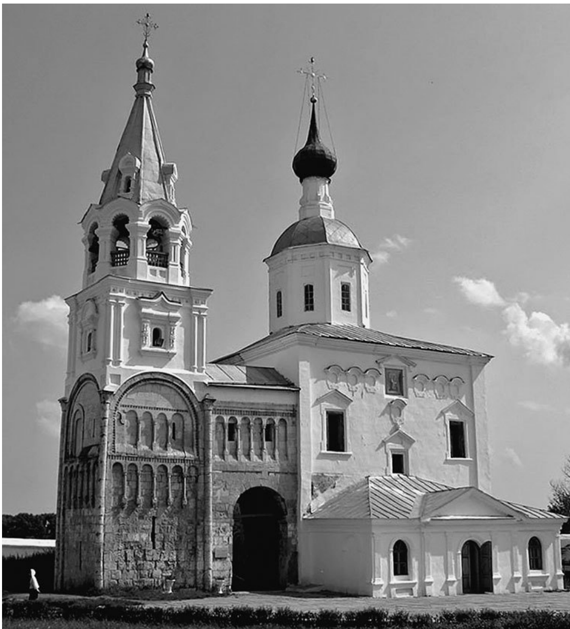
Боголюбово. Лестничная башня замка, место убийства князя Андрея

По словам историка В. О. Ключевского, «никогда на Руси ни одна княжеская смерть не сопровождалась такими постыдными явлениями». Князя не отпевали и не хоронили целых пять дней, а во Владимире все это время продолжался разгул черни.