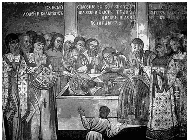
Погребение останков Андрея Боголюбского