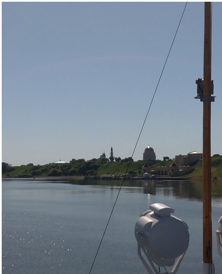
Тихо урча “Борис Полевой” пришвартовался к причалу.