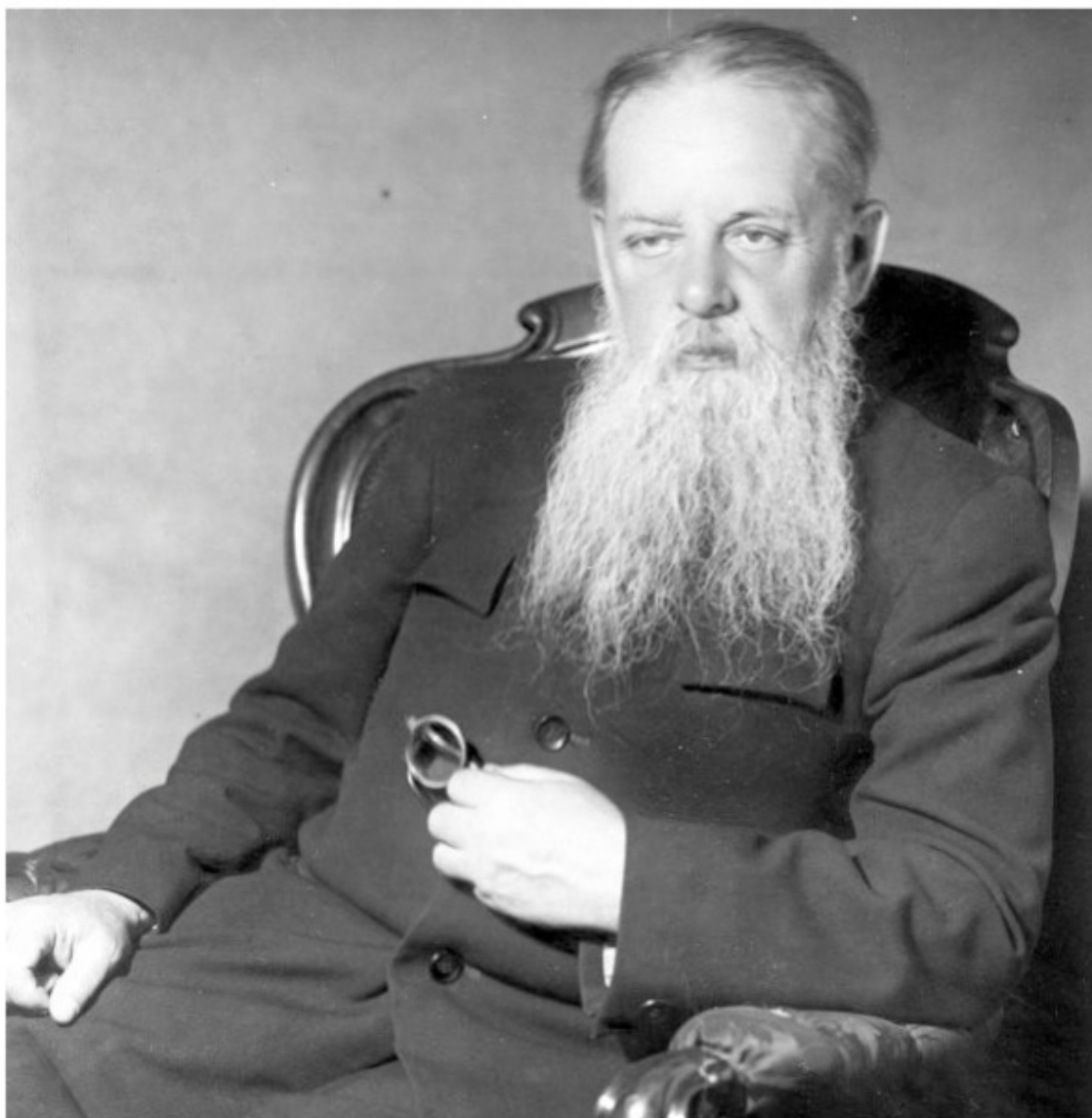
Павел Петрович Бажов. Русский и советский писатель, фольклорист, публицист, журналист. Мировую известность получил как автор уральских сказов.