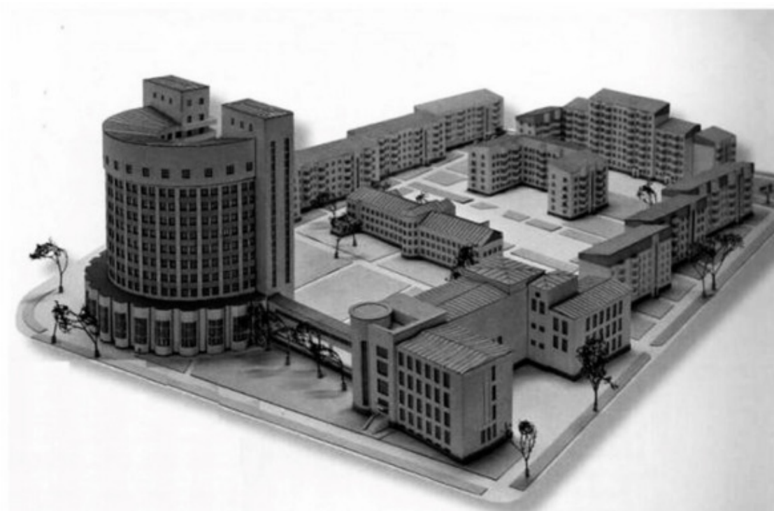
Комплекс зданий «Городок чекистов» (Жилкомбинат НКВД), 1932—1934 гг., архитекторы И. П. Антонов и В. Д. Соколов. В состав комплекса входили: дом гостиничного типа для малосемейных и молодежи, здание клуба и магазина, три жилых дома, медицинский корпус с аптекой, здание детского сада и яслей. Один из лучших в опыте советской архитектуры жилых комплексов конца 1920-х – начала 1930-х годов. Екатеринбург, проспект Ленина, 69