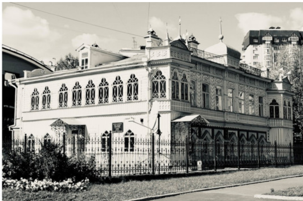
Дом Агафуровых, 1890-е годы.

Вот это поступок! Создатели фильма «12 лет рабства» нервно курят в сторонке.