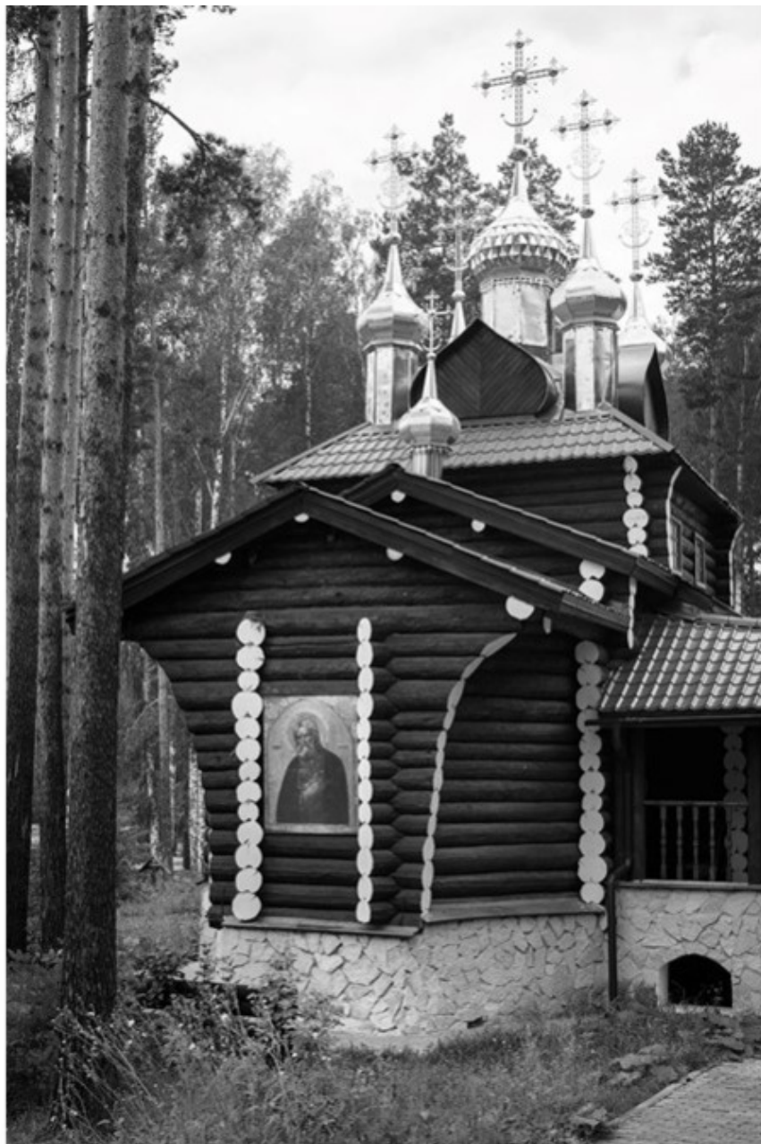
Храм во имя преподобного Серафима Саровского, 2000 год. Мужской монастырь во имя Святых царственных Страстотерпцев в урочище Ганина яма