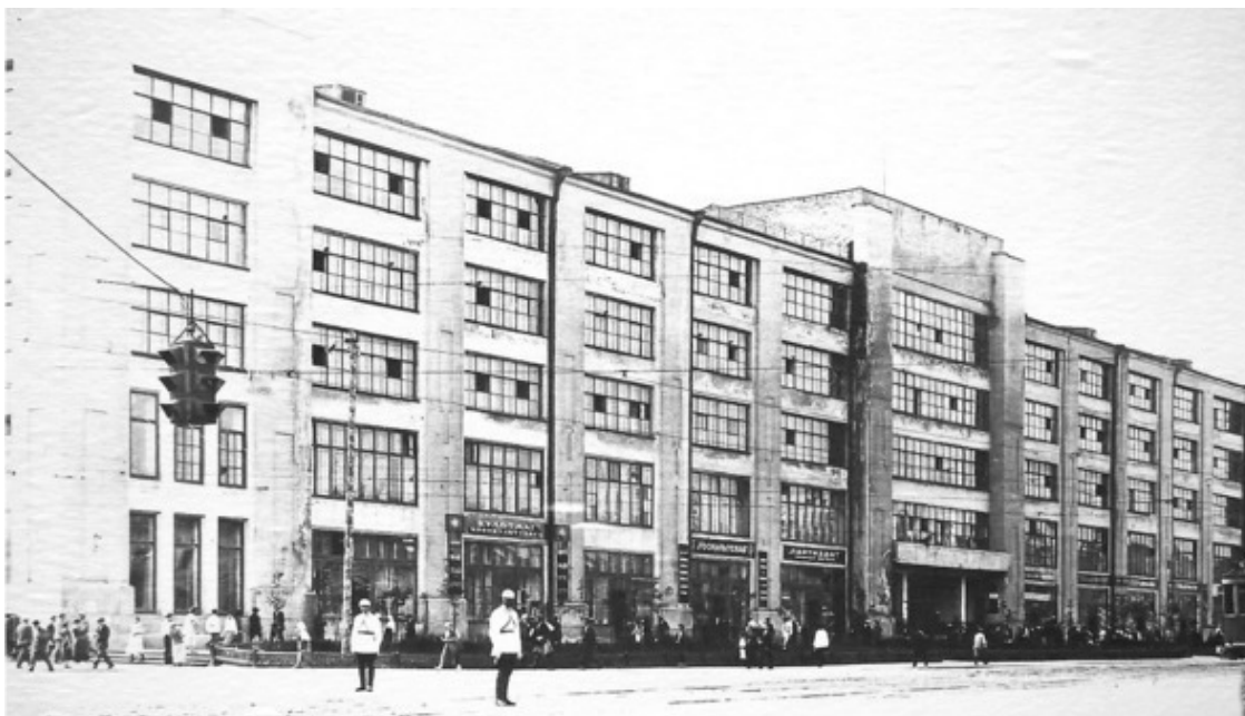
Здание Горсовета, 1928—1954 годы, архитекторы Г. А. Голубев и М. В. Рейшер, инженеры В. И. Калашиников и Ф. И. Клецев. Первоначальный вид здания, возведенного в формах конструктивизма.

После реконструкции 1954 года здание окончательно приобрело неоклассическую трактовку и стало архитектурной доминантой центральной площади Екатеринбурга.