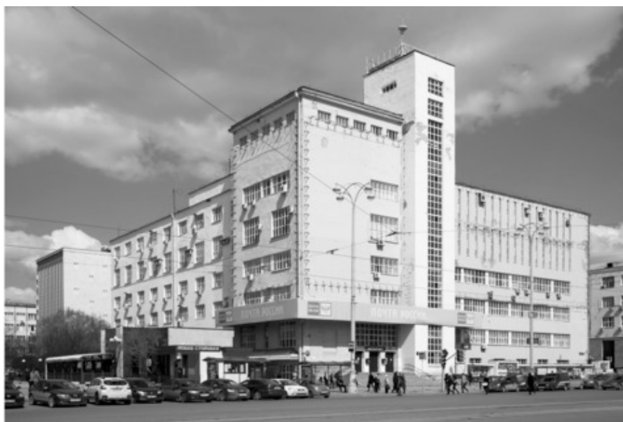
Дом связи (Главпочтамт), 1933 год, архитекторы К. И. Соломонов и В. Д. Соколов. Образец крупного общественно-производственного здания с применением принципов функционального метода в планировочном решении внутреннего пространства. Екатеринбург, проспект Ленина, 39

На проявление новых архитектурных форм влиял и социальный заказ: изменение сознания требовало создания нового, социалистического быта. Молодые архитекторы отказывались от старых, изживших себя традиций. Они искали новые решения и формы, использовали современные строительные материалы (например, железобетон). Новые социальные потребности людей порождали новые типы зданий: дома-коммуны, фабрики-кухни, дворцы труда, рабочие клубы.