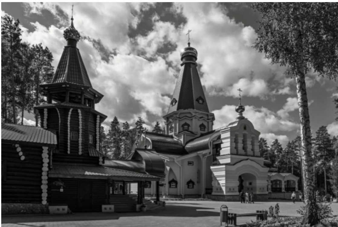
Мужской монастырь во имя Святых царственных Страстотерпцев в урочище Ганина яма. Храм во имя святых Царственных Страсто- терпцев (слева) и Храм в честь Державной иконы Божией Матери (справа)

Действующий мужской монастырь царственных страстотерпцев на Ганиной яме находится примерно в 20 км от Екатеринбурга, но подавляющее большинство туристов, приезжающих в город, обязательно едут и на Ганину яму.