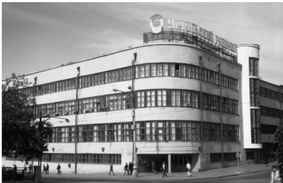
Дом печати (здание типографии издательства «Уральский рабочий»), 1930 год, авторы проекта Г. А. Голубев и В. А. Сигов. Пример производственного здания конца 1920-х – начала 1930-х годов. Екатеринбург, проспект Ленина, 49