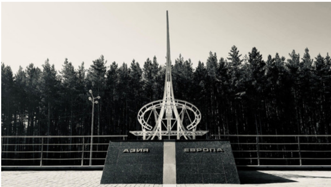
Знак Граница Европы и Азии, 2004 год, автор К. В. Грюнберг. 17-й километр Ново-Московского тракта (координаты – Екатеринбург, Р-242, 344-й километр)

Да-да, граница. Екатеринбург (в определенном смысле слова) – приграничный город. Граница Европы и Азии проходит по Уральскому горному хребту, а Екатеринбург расположен у подножия хребта с восточной стороны. Выехав из города в западном направлении, можно посетить сразу 3 обелиска «Европа-Азия». Местоположение города на восточном склоне Среднего Урала делает Екатеринбург азиатским городом. Для многих гостей, кстати, этот факт является неожиданным. Не все осознают, что, приехав в Екатеринбург, они оказываются в Азии.