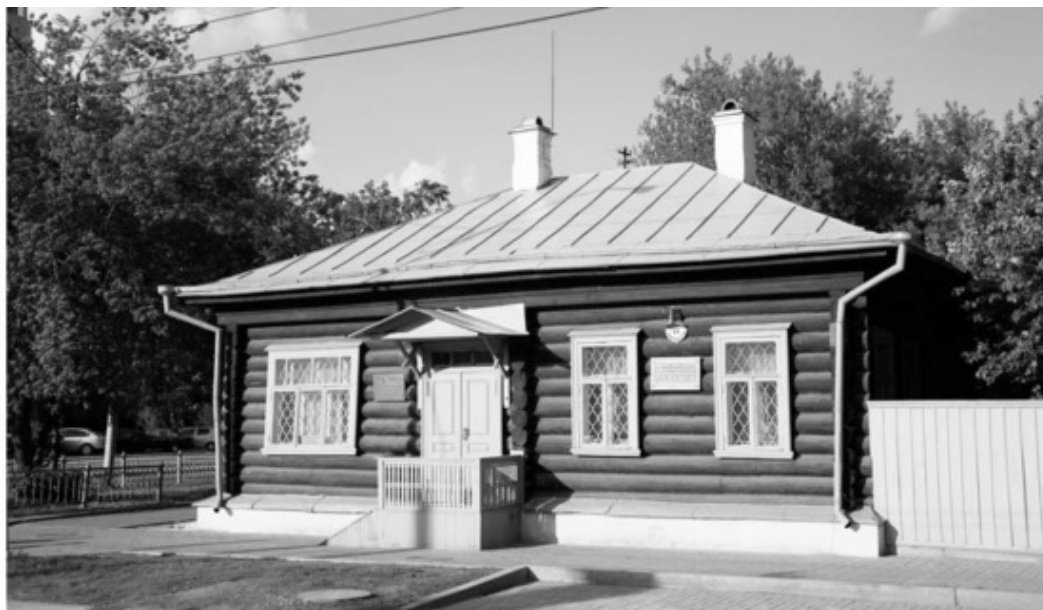
Дом П. П. Бажова, в котором он жил с 1906 по 1950 гг. С 1969 г. – дом-музей Бажова. Екатеринбург, улица Чапаева, 11