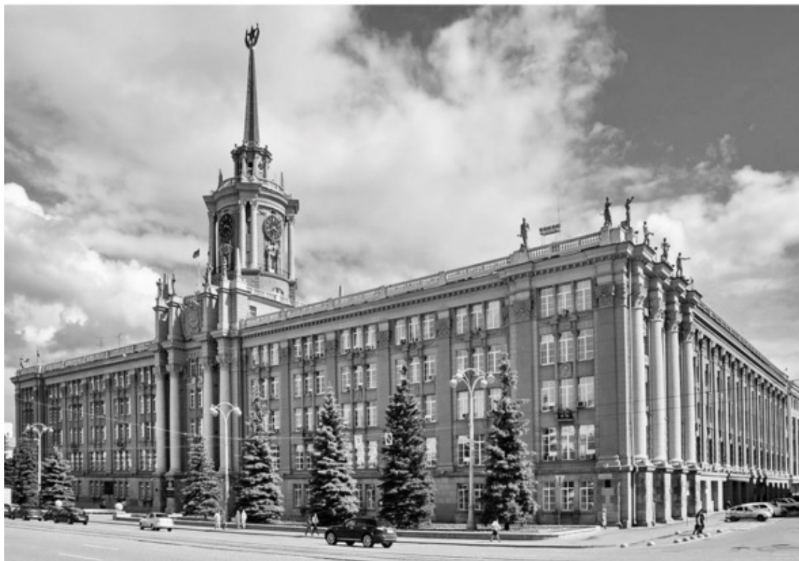
Современный вид здания Администрации Екатеринбурга в неоклассической трактовке. Екатеринбург, проспект Ленина, 24а

Здание Администрации города Екатеринбурга, Екатеринбургской городской Думы и Избирательной комиссии муниципального образования «город Екатеринбург» является на сегодняшний день памятником архитектуры Екатеринбурга регионального значения.