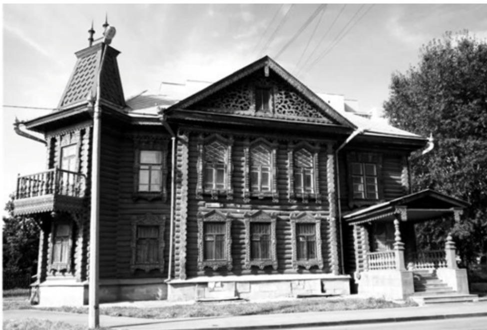
Дом Агафуровых, 1896—1898-е годы. В настоящее время – музей купеческого быта. Екатеринбург, улица Сакко и Ванцетти, 28

В июле 1919 года Агафуровы покинули Екатеринбург с отступающими войсками Колчака. В 1933 году в истории империи Агафуровых была поставлена точка.