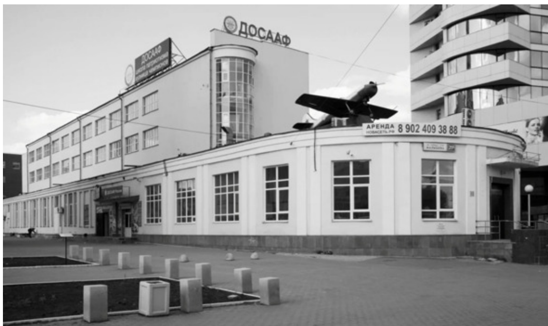
Дом обороны (ДОСААФ), 1930-е годы, архитектор Г. П. Валенков. Екатеринбург, улица Мальшиева, 31д / улица 8 Марта, 17