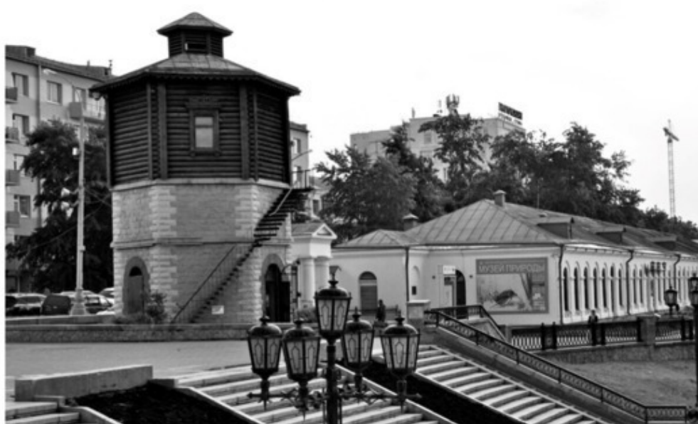
Водонапорная башня железнодорожных мастерских Екатеринбурга. Дата постройки не известна (не ранее 1887 года). Архитектор неизвестен. В настоящее время – Музей истории Екатеринбурга. Екатеринбург, улица Горького, 4в