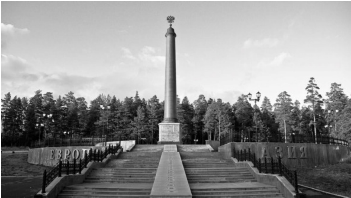
Знак Граница Европы и Азии, 2008 год. Город Первоуральск (окрестности), Свердловская область. Расположен в месте установки первого в истории знака «Европа-Азия» в 1837 году.