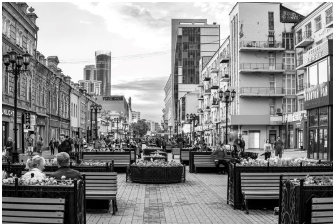
«Уральский Арбат» – пешеходная улица Вайнера. Презжие названия: Манакова, Денисова, примерно с 1845 года – Успенская