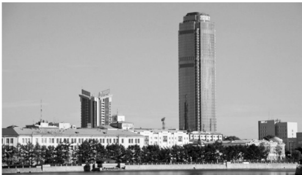
Бизнес-центр «Высоцкий», строительство 2006—2011 годы. Высота: крыши – 188,3 м, верхнего этажа – 182,93 м. Количество этажей – 54. Параметры приведены без учета бассейна на крыше. Екатеринбург, улица Мальшева, 51

Захватывающий вид на Екатеринбург открывается с открытой смотровой площадки, расположенной на 52 этаже «Высоцкого» (на высоте 186 метров).