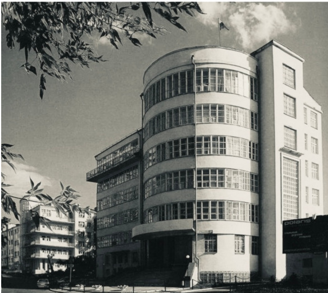
Городок юстиции (Здание юридического института), 1930-е годы, автор проекта Захаров С. Е. Образец административного сооружения начала 1930-х годов, объемно-пространственная композиция которого характеризуется единством функционального и образного решения. Екатеринбург, улица Мальшиева, 26