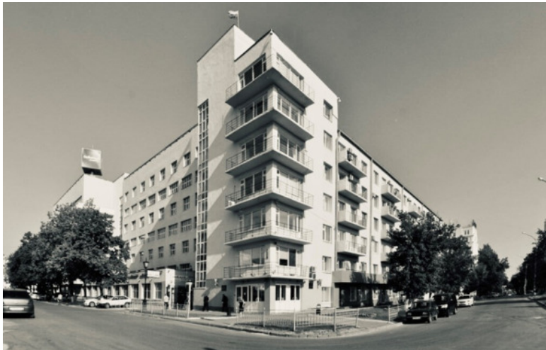
Административное здание, 1930-е годы, архитекторы Захаров С. Е., Макаров А. К., Нейман И. Ф. Екатеринбург, проспект Ленина, 34 / улица Пушкина, 11