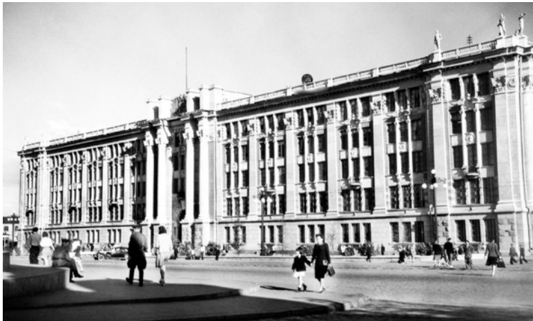
Здание Горсовета после реконструкции, начатой в 1944 году.