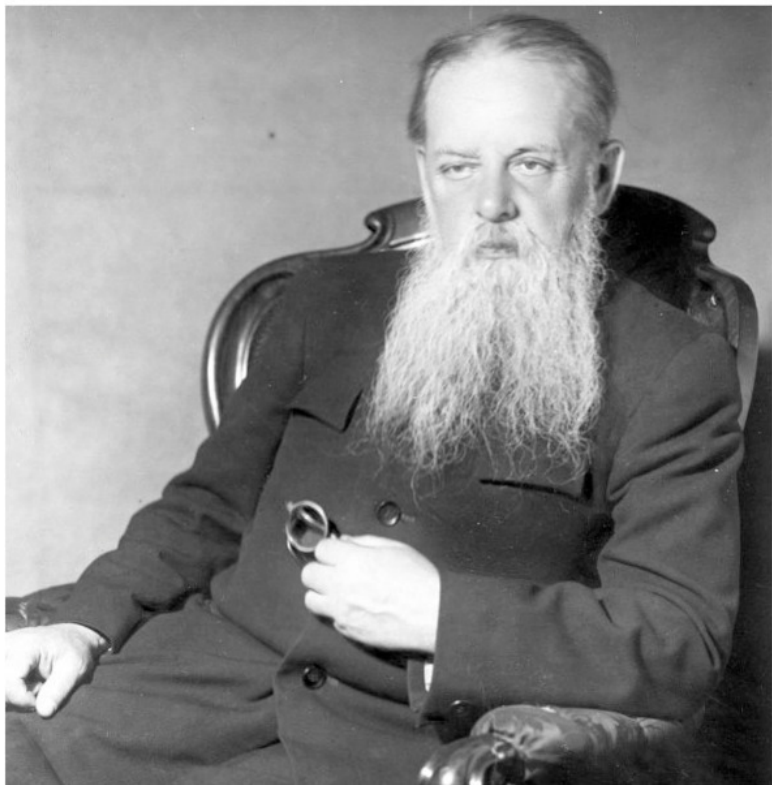
Павел Петрович Бажов. Русский и советский писатель,