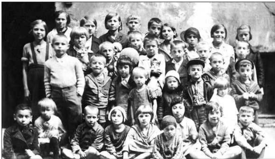
Дети предвоенного ленинградского двора. Публикуется впервые