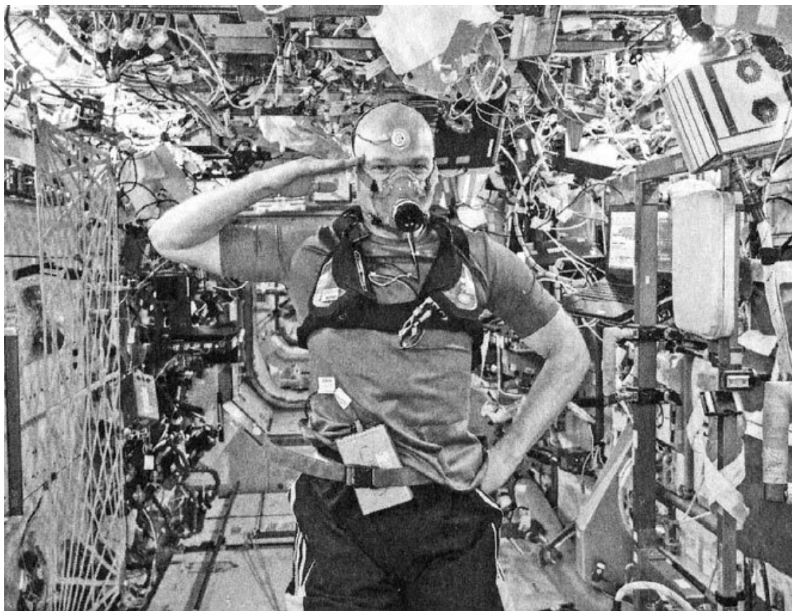
Астронавт, геофизик и вулканолог Александр Герст на борту МКС во время проведения эксперимента по постоянному измерению температуры тела