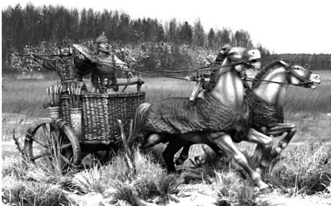
Боевая колесница древних индоевропейцев

Первоначально индоевропейцы занимались, главным образом, скотоводством и вели полукочевой патриархальный образ жизни. Они выращивали лошадей, возможно, использовали их и для верховой езды. Разводили овец и коз. Их высокую подвижность может объяснить тот факт, что в начале 3 тысячелетия до н. э. они изобрели колесницу с колесами на спицах и вращающуюся втулку на оси. Это сравнимо с переходом от паровоза к самолету. Они ворвались, как всемогущие боги, на своих колесницах, сокрушая матриархальные земледельческие культуры покоряемых территорий. На раскопках в Аркаиме и Синташте найдены останки лошадей четырех разных пород и колесница.