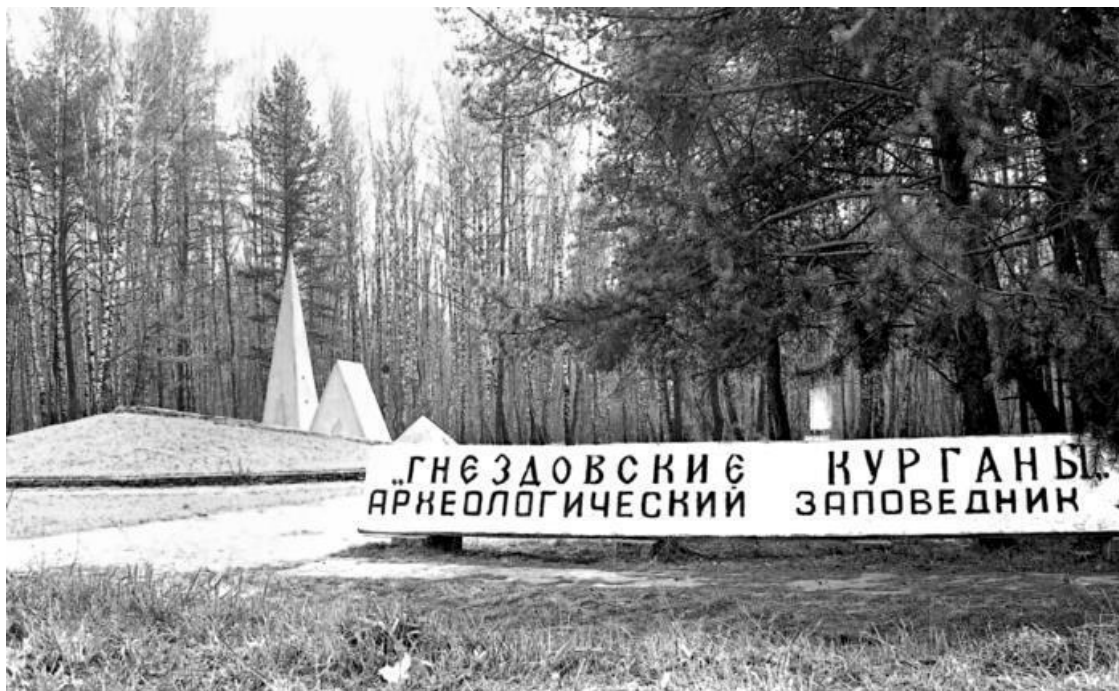
Археологический заповедник «Гнёздовские курганы»

В брак в те времена вступали в 14–15 лет, а зачастую и раньше. Рождаемость была высокой, но и смертность тоже. В среднем в семье насчитывалось по четыре ребенка. Почти у всех народов, включая славян и балтов, в той или иной форме практиковалось многоженство.