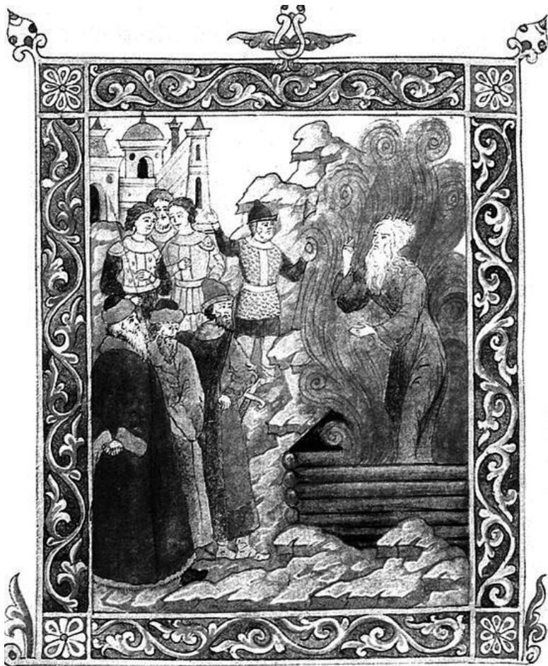
9. Сожжение протопопа Аввакума. Рисунок А. А. Великанова из его рукописи «Житие протопопа Аввакума». Яро-