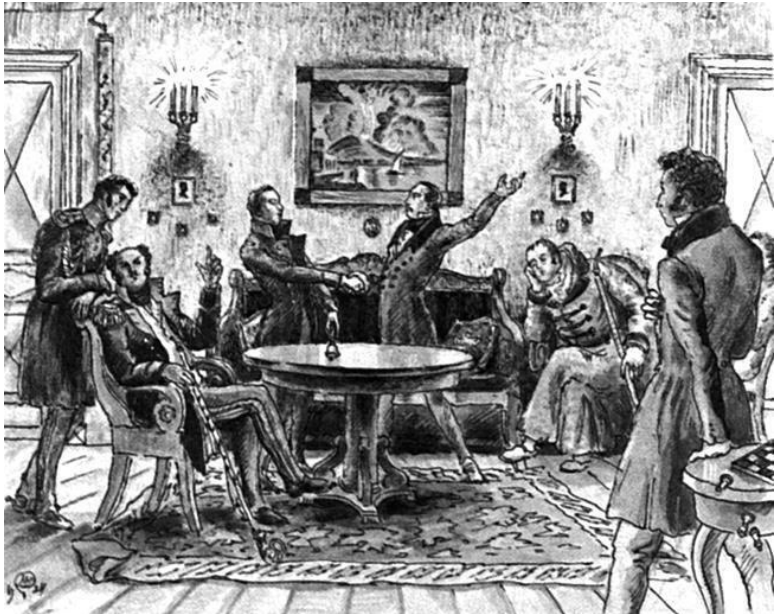
6. Декабристы. Художник М.В. Добужинский

глядит Россия по сравнению с Европой: самый бедный европейский крестьянин жил несравненно лучше наших крестьян; самый необразованный европейский обыватель был намного более цивилизован, чем наши обыватели; самый грубый произвол власти не мог сравниться с российским произволом; самые вопиющие покушения на естественные права человека казались пустяком по сравнению с тем, что творилось у нас.