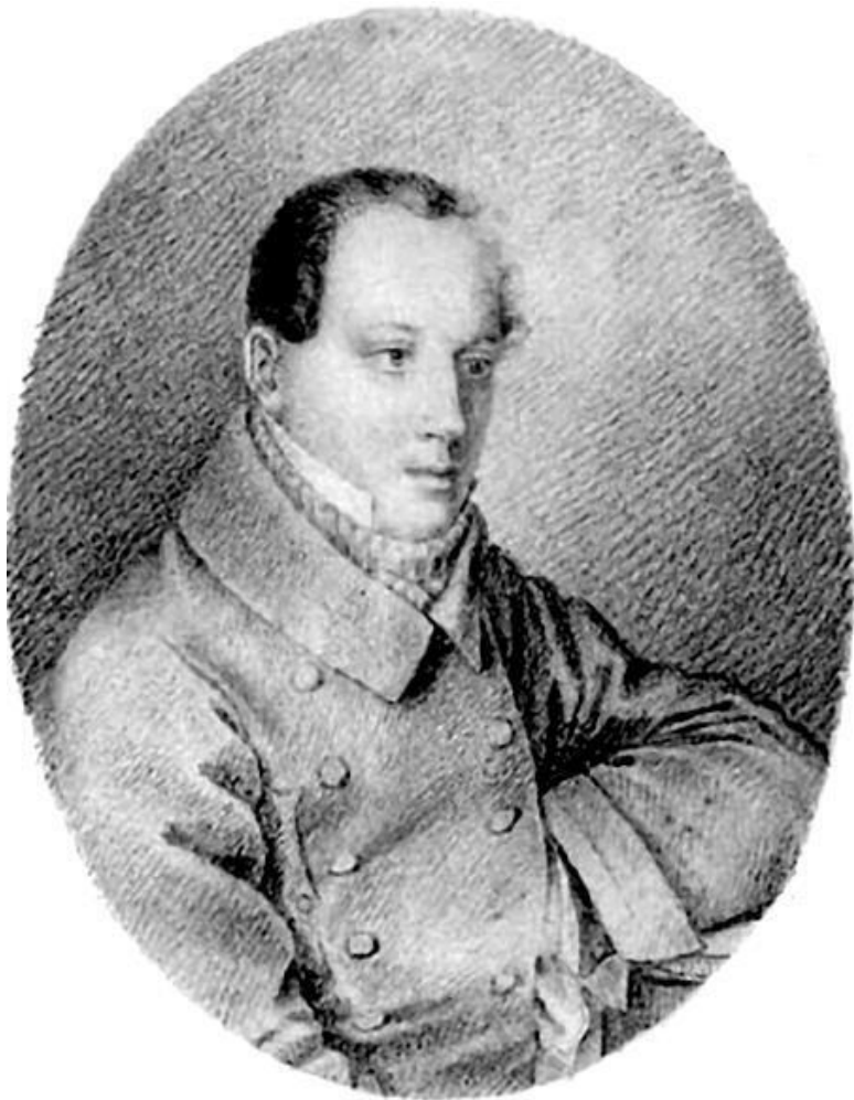
2. П.Я. Чаадаев. Художник И.Е. Вивьен.