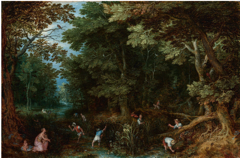
Ян Брейгель Старший. Латона и ликийские крестьяне (деталь). ок. 1605. Государственный музей, Амстердам

Чтобы усложнить Лето жизнь, Гера решила задержать на Олимпе богиню Илифию, без которой никто на земле не рождался. Вот это уже выглядит плохо в биографии Геры. Если без Илифии никто не рождался, то, значит, страдала не только Лето. Никто не мог родить. А Гера удерживала Илифию, на секундочку, девять дней (запомните этот срок, позже пригодится). Как-то некрасиво вышло, Гера. Осуждаем.