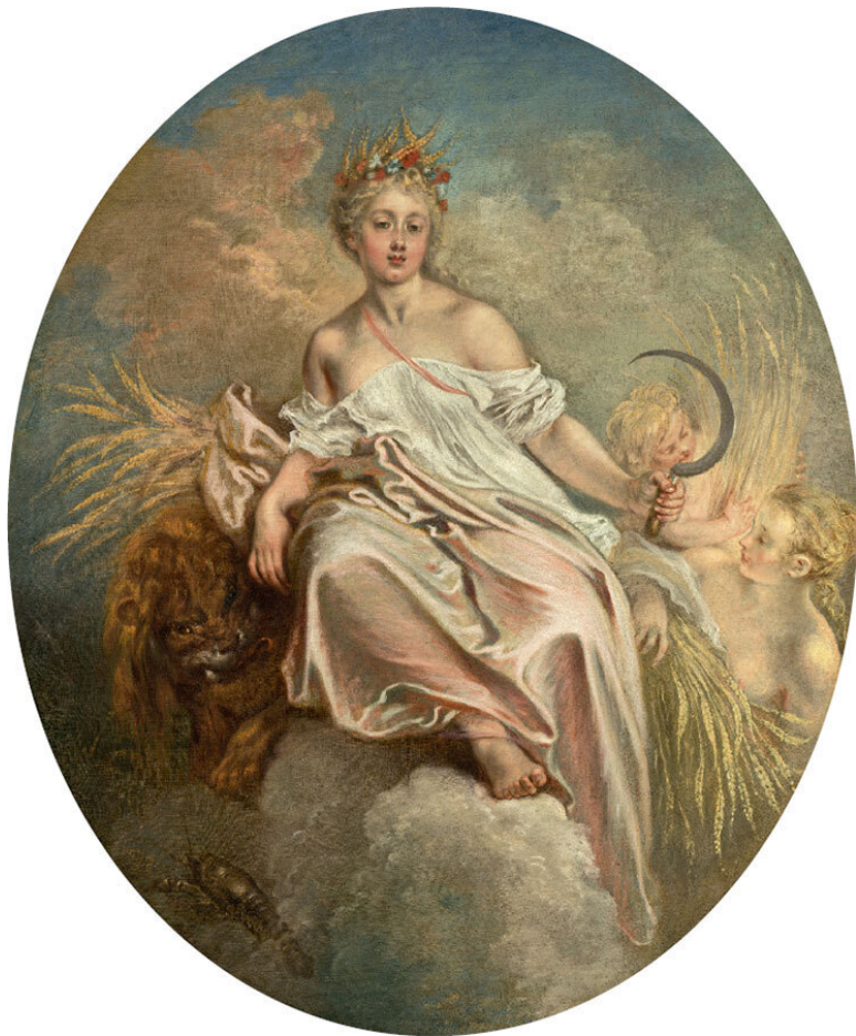
Антуан Ватто. Церера (Лето). Около 1717/1718 г. Национальная галерея искусств, Вашингтон