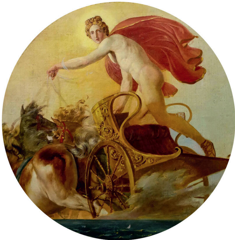
Карл Брюллов. Фаб на колеснице. 1846. Государственный Русский музей, Санкт-Петербург

ный сезон, да еще и похищение это, как-то не до еды было.