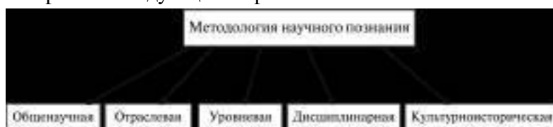
Рис. 2. Структура современной методологии научного познания

Схематически общая структура современной методологии научного познания может быть изображена следующим образом: