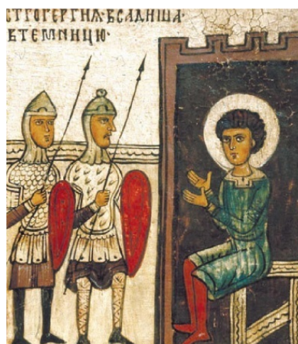
4. Св. Георгий в темнице Клеймо иконы «Чудо св. Георгия о змие, с житием»

– О, император, – отвечал святой, – я полагал, что ты не откроешь свои уста на хуление всесильного Бога, для Которого все возможно и Который избавляет от бед уповающих на Него. Ты же, будучи прельщен дьяволом, впал в такую глубину заблуждения и погибели, что называешь волхвованием чудеса Бога моего, которые видят глаза ваши. Плачу я о вашей слепоте, называю вас окаянными и считаю недостойными моего ответа.