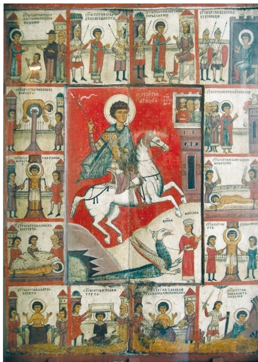
Чудо св. Георгия о змие, с житием Первая половина XIV в. Новгород. Дерево, темпера. 89,5 x 63 см Государственный Русский музей (ГРМ), С.-Петербург

Диоклетиан стал выяснять, что это за праведники, из-за которых не может пророчествовать бог Аполлон. Жрецы отвечали, что праведными являются христиане. Услышав это, Диоклетиан исполнился гнева и ярости на христиан и возобновил гонение на них, прекратившееся было к тому времени. Обнажил он меч свой на праведных, неповинных и непорочных людей Божиих и послал повеление казнить их во все страны своей империи. И вот темницы наполнились исповедующими истинного Бога вместо прелюбодеев, разбойников и дурных людей. Обычные способы мучений были отменены как неудовлетворительные, и были изобретены лютейшие муки, которым и подвергали множество христиан. Со всех сторон, особенно с востока, к императору потекли письменные клеветнические доносы на христиан.