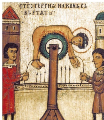
5. Мучение св. Георгия на колесе Клеймо иконы «Чудо св. Георгия о змие, с житием»