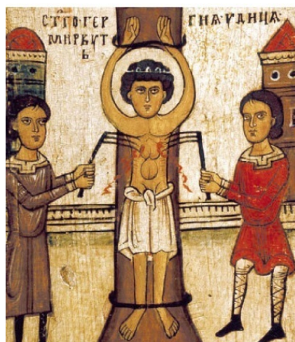
7. Мучение св. Георгия удищами Клеймо иконы «Чудо св. Георгия о змие, с житием»