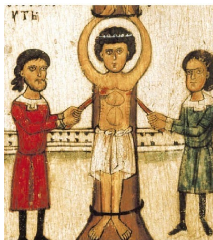
10. Св. Георгия жгут свечами Клеймо иконы «Чудо св. Георгия о змие, с житием»