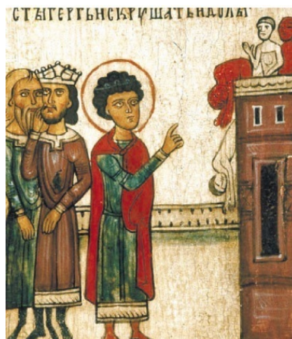
6. Св. Георгий молитвой сокрушает языческих богов Клеймо иконы «Чудо св. Георгия о змие, с житием»