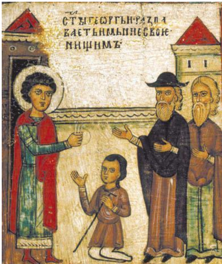
1. Св. Георгий раздает имущество нищим Клеймо иконы «Чудо св. Георгия о змие, с житием»