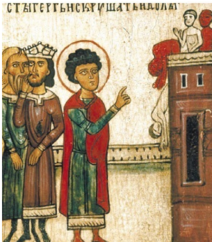
6. Св. Георгий молитвой сокрушает языческих богов Клеймо иконы «Чудо св. Георгия о змие, с житием»