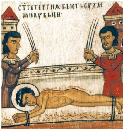
9. Избиение св. Георгия дубовыми прутьями Клеймо иконы «Чудо св. Георгия о змие, с житием»