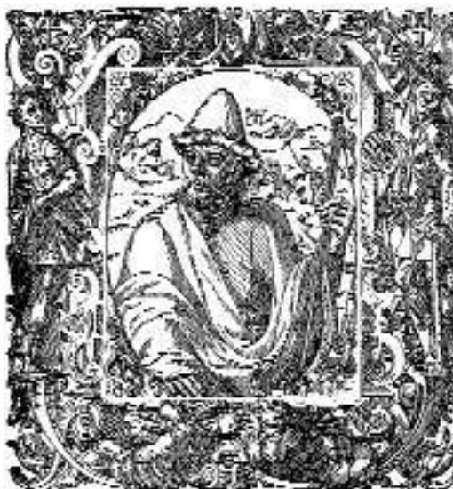
Правитель, полководец и завоеватель Тамерлан

В недрах Азии появился новый грозный завоеватель, не менее знаменитый и ненасытный, чем Чингисхан, от которого он и происходил по женской линии. Это был Тамерлан, или Темир-Аксак, прозванный также за свою храмоту Железным Хромцем. Будучи мелким монгольским князьком, Тамерлан терпел в юные годы различные испытания и невзгоды, среди которых закалялся его дух и зрели его замыслы о повторении времен Чингисхановых. В 1352 году все достояние Тамерлана, укрывавшегося в пустыне от врагов, заключалось в тощем коне и дряхлом верблюде, а несколько лет спустя благодаря своим удивительным военным и государственным дарованиям, соединенным с бесчеловечной кровожадностью, он был уже повелителем 20 держав в трех частях света – Азии, Европе и Африке. В числе этих подвластных ему держав были владения Персидские, Индийские, Сирийские, Египетские, а также Волжская, или Золотая Орда, в которой Тохтамыш занял престол после Мамая именно благодаря покровительству Тамерлана.