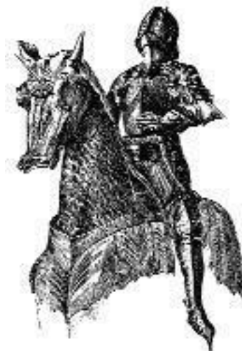
Вооружение немецкого рыцаря в начале XV в.

Спасли честь польско-литовских знамен доблестные русские войска. Три смоленские хоругви, со всех сторон окруженные огромным количеством рыцарского войска, долго и мужественно отбивались, причем одна из них была поголовно истреблена, но не сдалась. Две же другие пробившись с большими потерями и вышли на выручку к польским хоругвям, которым приходилось плохо: немцы добирались к королевскому знамени, выпавшему из рук знаменосца; в это же время и сам Ягайло был чуть не убит наскочившим на него смелым рыцарем. Своевременный выход доблестных смолян на помощь полякам, к которым направились затем на поддержку и другие русские хоругви, переменял положение дел на поле сражения.