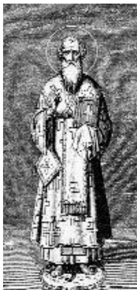
Святой Фотий – митрополит Московский

Победа на Зеленом поле очень подняла значение Витовта, поникшее после поражения на Ворскле. У татар же не прекращались взаимные раздоры, и сила их быстро падала. Престарелый Эдигей, уступив в конце концов Волжскую, или Золотую, Орду сыновьям Тохтамыша, властвовал сам над ордами, занявшими Черноморское побережье. Он вел еще некоторое время борьбу с Витовтом и в 1411 году, подойдя к Киеву, ограбил его и разорил все церкви, в том числе и Печерскую лавру. Но затем он отправил к Витовту посольство с богатыми дарами и следующим словом: «Князь знаменитый! В трудах и подвигах честолюбия застигла нас унылая старость; посвятим миру остаток жизни. Кровь, пролитая нами в битвах взаимной ненависти, уже поглощена землею; слова бранные, какими мы друг друга огорчали, развеяны ветрами; пламя войны очистило сердца наши от злобы. Вода угасила пламя». Они заключили мир.