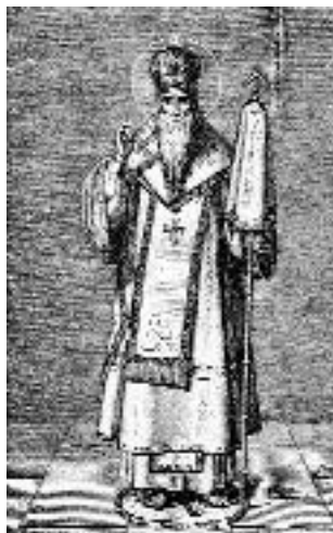
Святой Киприан – митрополит Московский

В эти бедственные дни великий князь Василий Димитриевич показал себя достойным преемником своего великого отца. Подобно ему, он начал созывать русских людей на страшный бой с грозным врагом, и на призыв его стали отовсюду собираться полки. Многие старцы, славные участники Куликовской битвы, сели вновь на коней и явились под знамена, чтобы умереть за свою Родину и за веру православную. Сам великий князь начальствовал над войском и расположился близ Коломны, на берегу реки Оки, бодро ожидая дальнейших действий врага и оставя престарелого князя Владимира Андреевича для защиты Москвы, где народ денно и ночью молился во всех храмах. Желая успокоить жителей столицы, Василий Димитриевич написал из своего стана митрополиту Киприану, чтобы он перенес в Москву славную икону Божией Матери из стольного города Владимира.