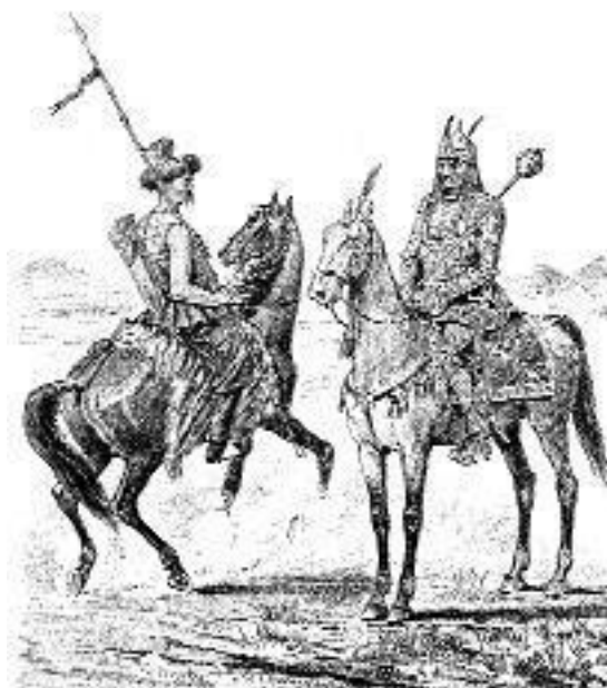
Тяжело вооруженная конница Тамерлана

А за эти три дня к Темир-Кутлую подошел поседевший в боях сподвижник Тамерлана, князь Эдигей, также распорядившийся самовластно в Орде именем хана, как это в свое время делал Мамай.