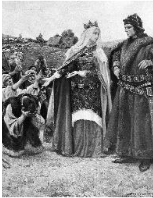
Королева Польши Ядвига и литовский князь Ягайло

При этих условиях принятие Ягайлой польской короны и католичества повлияло, конечно, самым неблагоприятным образом на православных подданных литовского князя, так как на него скоро возымело сильнейшее влияние польское католическое духовенство. И вот после казни двух своих придворных, не захотевших изменить православию, Ягайло издал в 1387 году указ, предписывавший всем литовцам знатного рода принимать католическую веру, причем в эту веру должны были непременно переходить и русские, бывшие в браке с литовцами; упорствующих же приказано было жестоко сечь розгами.