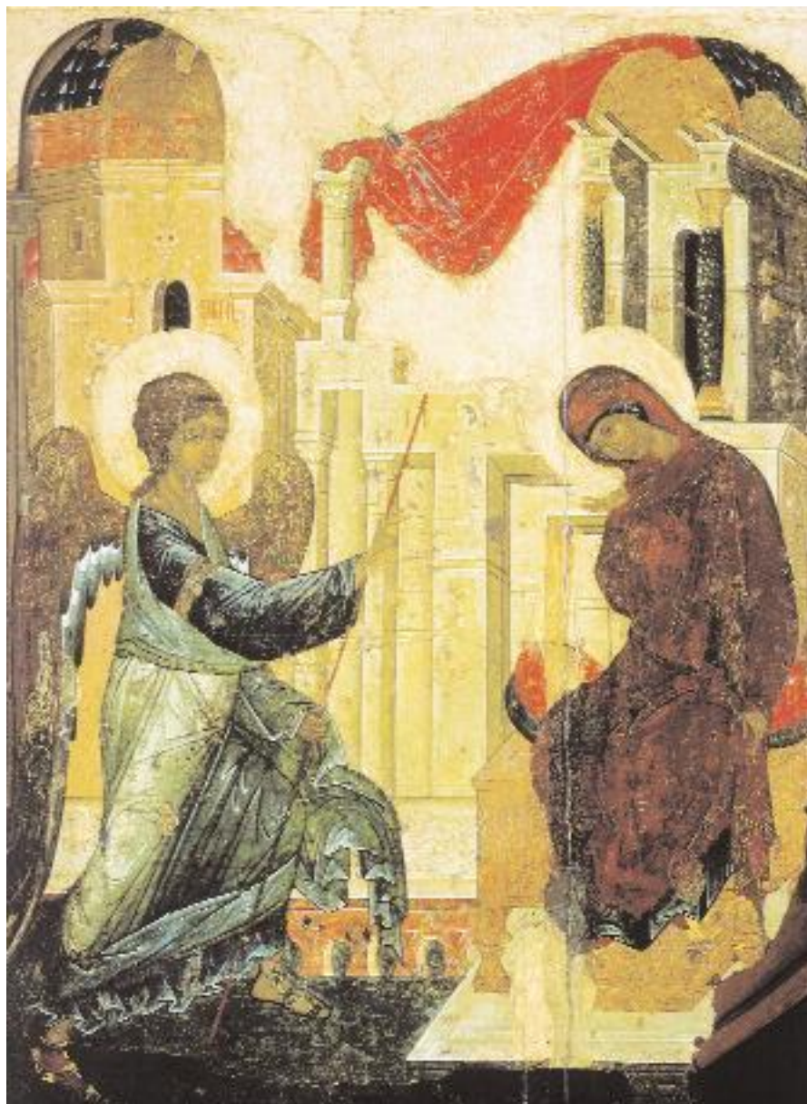
Благовещение. Икона. XV в. А. Рублев

Конечно, следствия этого разделения не замедлили сказаться. Витовт тотчас же послал Цамблака с литовскими панями в Швейцарию на происходивший там под председательством папы известный Констанцкий собор, чтобы хлопотать об унии или присоединении греческой веры к латинской, но Цамблак прибыл, когда уже собор кончался, и успеха в своем посольстве не имел.