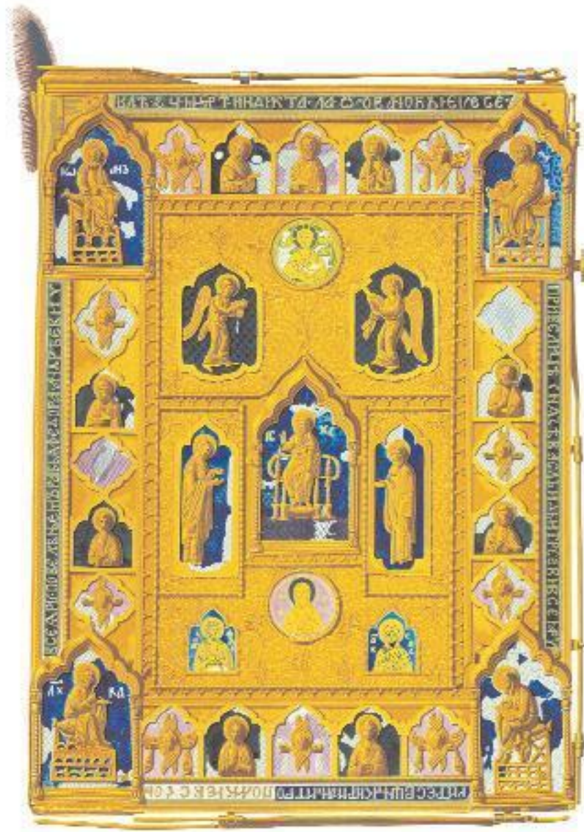
Ф. Солнцев. Напрестольное Евангелие конца XIV в.