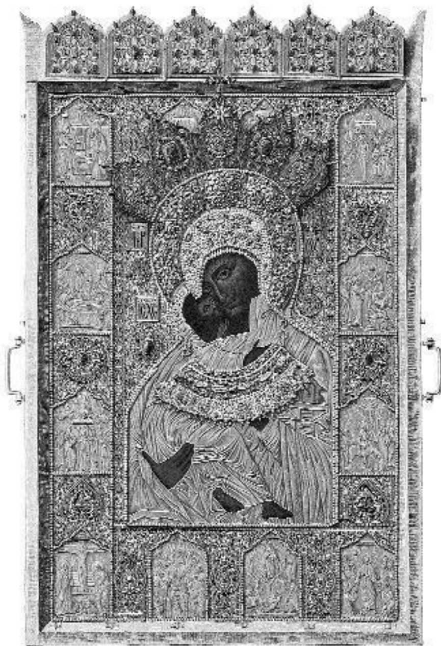
Чудотворный образ Владимирской Божьей Матери. Ф. Солнцев

Покорив Баязета, Тамерлан пребывал большею частью в Самарканде, причем он, по примеру Чингисхана, сея всюду ужас и разорение, проливая потоки крови, воздвигая огромные пирамиды из человеческих черепов и обращая в груды пепла цветущие города, любил беседовать с учеными, лицемерно показывая себя другом науки и пускался в длинные рассуждения о ничтожестве человеческой жизни, о добродетели и о бессмертии. Он умер и погребен в Самарканде же, входящем ныне в состав нашего Туркестанского военного округа. Посреди великолепной мечети, выстроенной для упокоения его останков, находится роскошная гробница, но она заключает в себе лишь прах его учителя. Сам же Тамерлан, до конца жизни оставаясь лицемером, смиренно приказал себя похоронить у его ног.