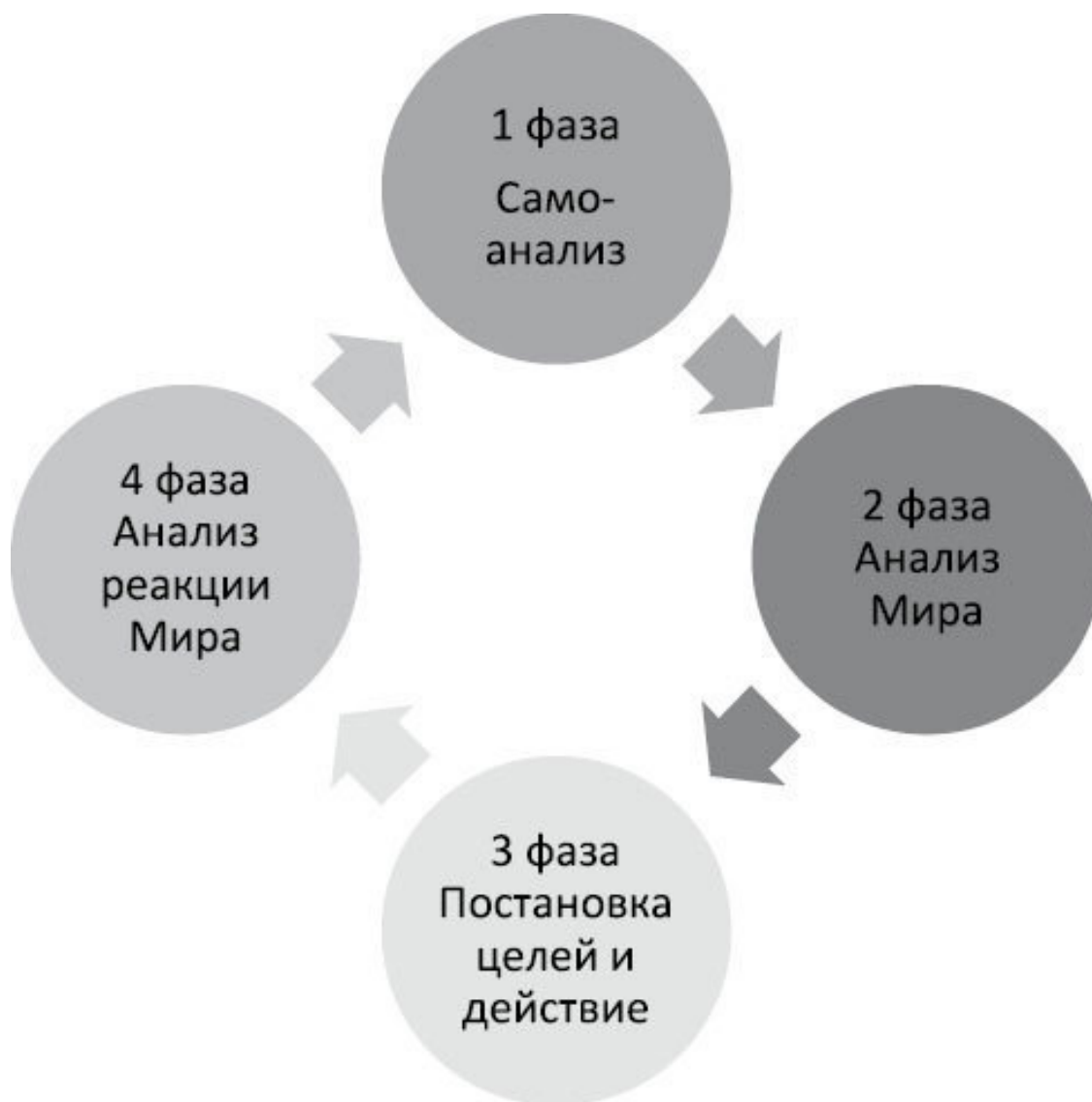
Рис. 2. Фазы саморазвития через самопознание

Понимание и развитие себя состоит из 4 фаз (рис. 2), которые человек проходит по кругу снова и снова, каждый раз на новом уровне: