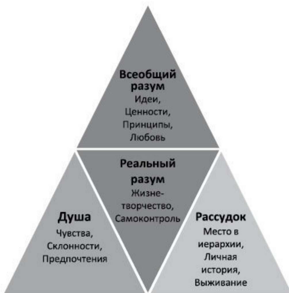
Рис. 3. Структура сознания человека

Первый этап жизни человека принято называть социальной адаптацией. Трудно переоценить его важность, но не стоит сводить к нему всю жизнь и все свои устремления. Обратимся к еще одной карте , существенной для наших вопросов – она представлена на рис. 3.