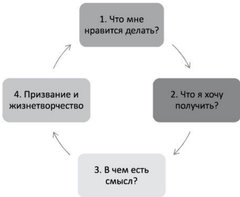
Рис. 4. Пошаговая схема работы сознания по выбору призвания

1. Я узнаю, что мне нравится делать (аспект душевной реализации ).