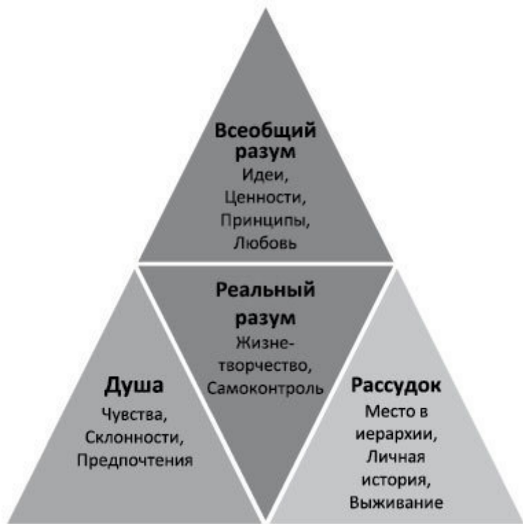
Рис. 3. Структура сознания человека

ной адаптацией. Трудно переоценить его важность, но не стоит сводить к нему всю жизнь и все свои устремления. Обратимся к еще одной карте , существенной для наших вопросов – она представлена на рис. 3.