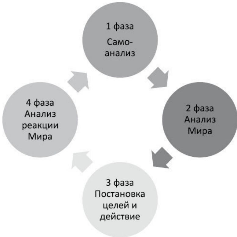
Рис. 2. Фазы саморазвития через самопознание