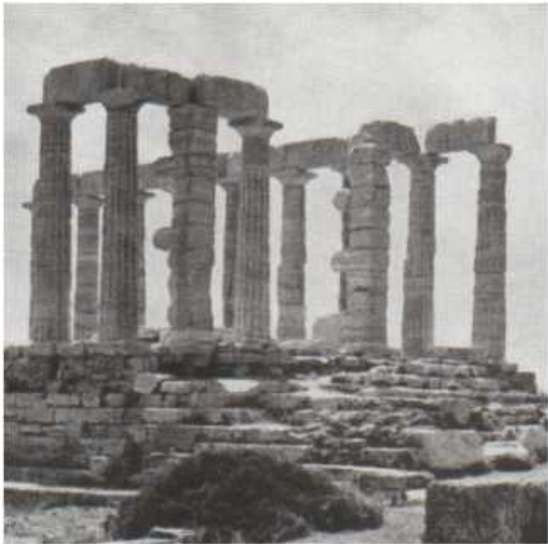
Ilona Kamad Ritual Side of Ancient Greek Religion