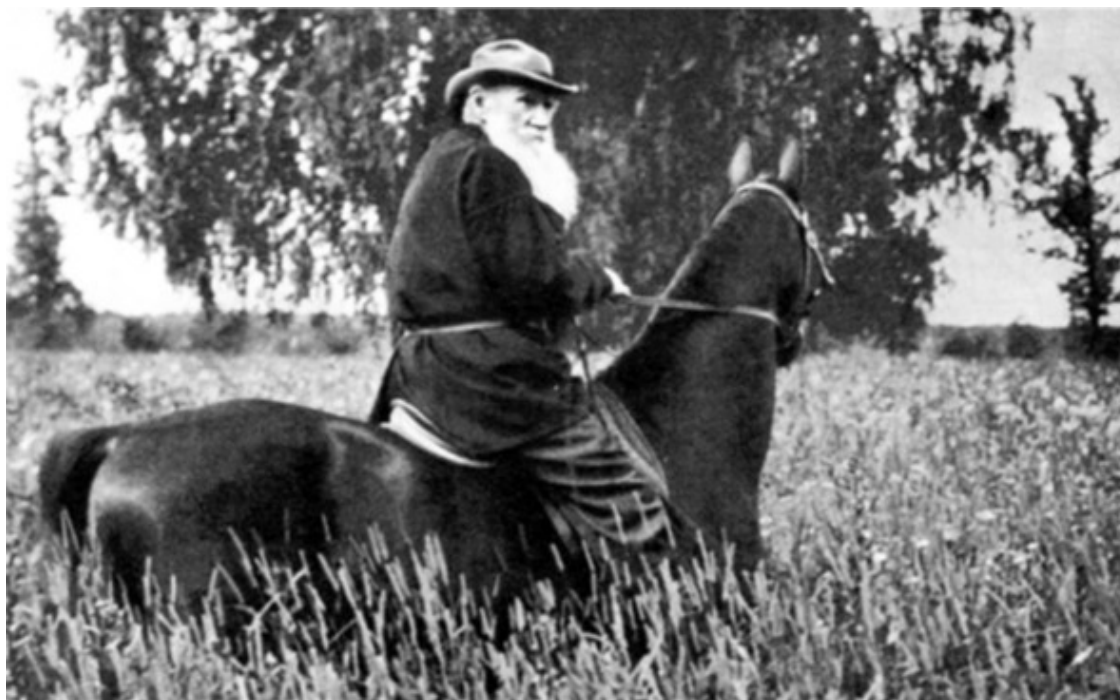
Лев Толстой в Ясной Поляне

«Ростов скакал назад с другими, испытывая какое-то неприятное чувство, сжимавшее ему сердце. Что-то неясное, запутанное, чего он никак не мог объяснить себе , открылось ему взятием в плен этого офицера и тем ударом, который он нанес ему». Что именно? А вот смотрим: Ростов ударил француза «сам не зная зачем». Это, конечно, не значит, что он не знает о том, что рубить в бою – положено по сценарию. Это значит лишь, что он действовал бессознательно, был вне себя. А как только пришел в себя стал размышлять о происшедшем. Но все не может понять, что с ним стряслось. Что-то не то. Ростов этим настолько подавлен, что даже не радуется тому, что генерал Остерман-Толстой вместо того, чтобы наказать за самовольную вылазку, благодарит и обещает представить к Георгиевскому кресту.