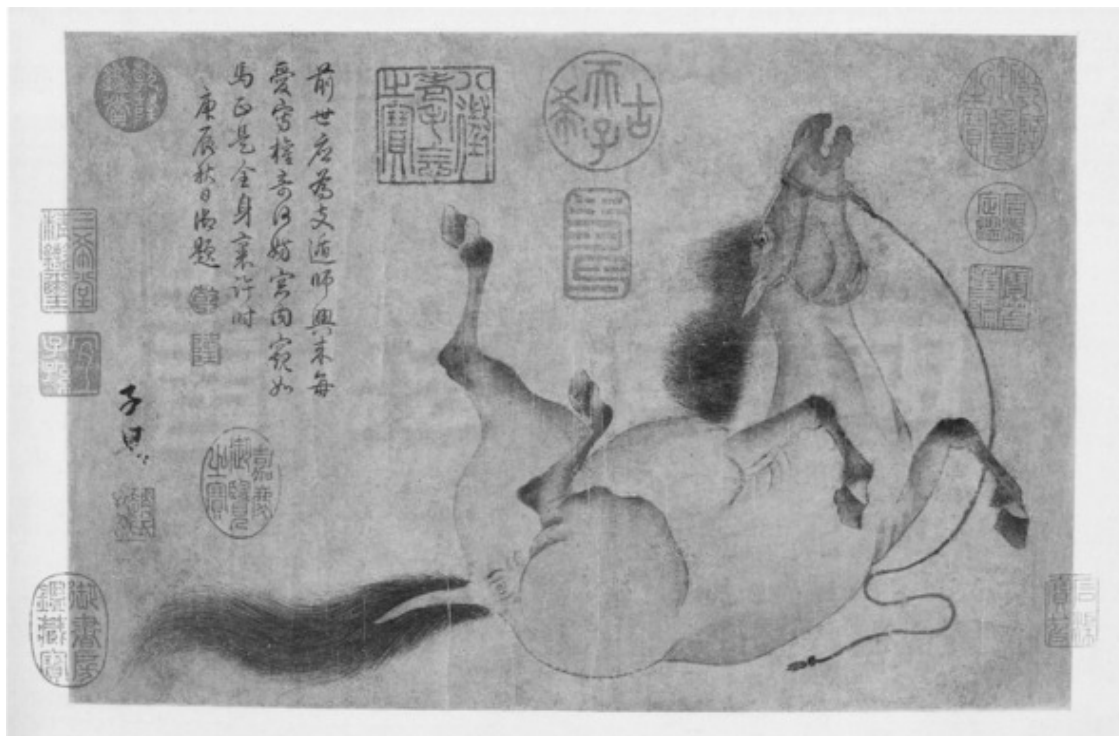
Работа Чжао Мэнфу (1254 —1322), великого китайского поэта, художника и каллиграфа времен династии Юань

Тут входит денщик. Почта. «Тот, казавшийся неразрешимым, узел, который связывал свободу Ростова, был разрешен этим неожиданным (как казалось Николаю), ничем не вызванным письмом Сони». Она писала, что решила «отречься от его обещаний и дать ему полную свободу». О как прёт! «То, о чем он только что молился, с уверенностью, что бог исполнит его молитву, было исполнено». Просто совпадение? Юнговская синхрония? Чудо? «Сяо Сян», комментируя третью позицию Кунь (Исполнение), говорит, что слова «может, и подчинишься в делах правителю» означают «осознание величия света».