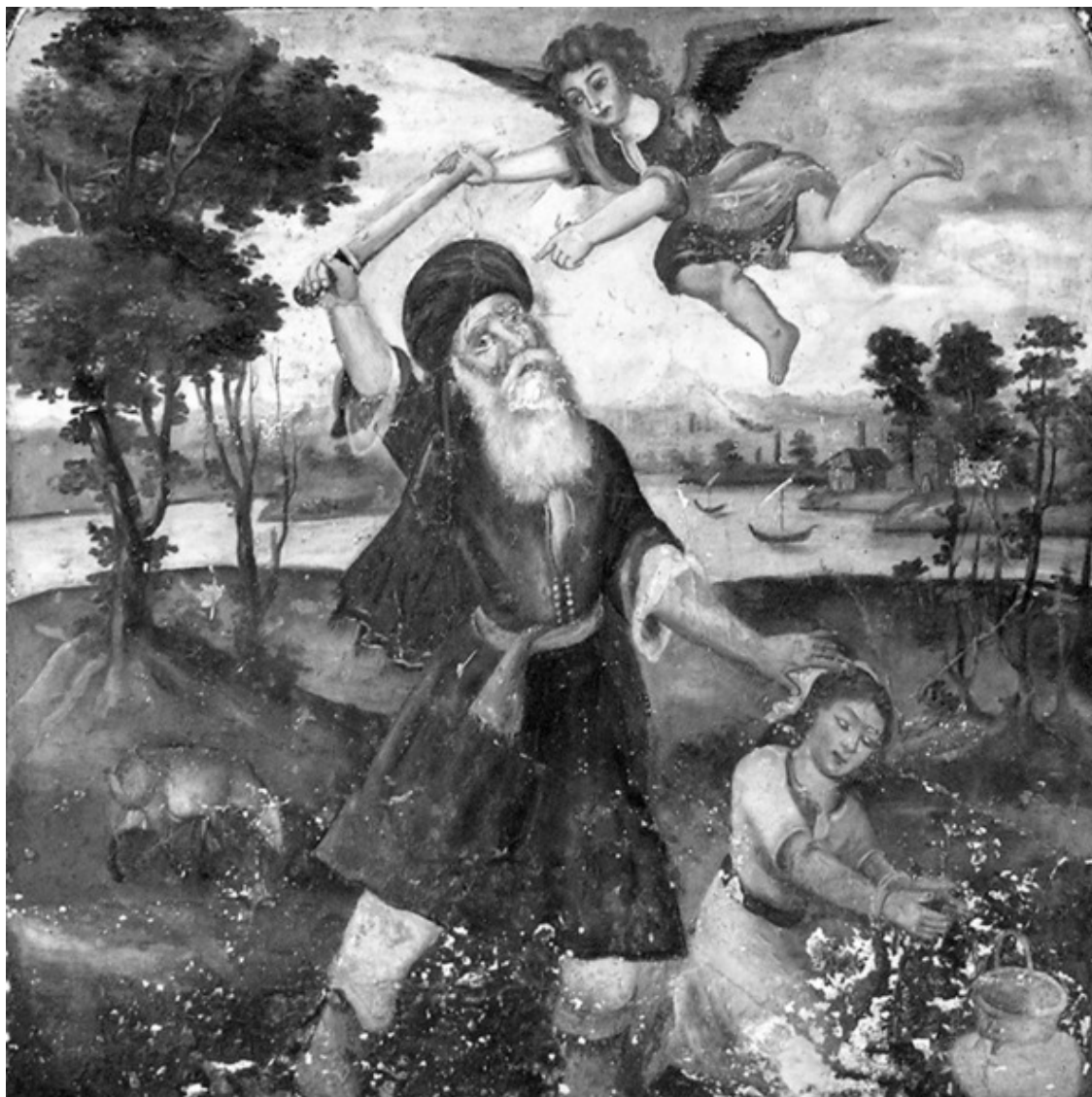
Авраам (Ибрагим) приносит в жертву сына. Фреска из Ширази

Первый этап – смена имени. Перед исходом евреев из Египта бог является Моисею и называет себя «Я есмь Суший» (что передают как YHWH, Яхве, Иегова, Господь). Новое имя сразу выводит бога Авраама из прежнего захолустного контекста, позиционирует его как бы всеобщим, тем, чье существо – в существовании. Но при этом бог все-таки уточняет: «Являлся Я Аврааму, Исааку и Иакову с [именем] „Бог Всемогущий“ (Эль Шаддай), а с именем [Моим] „Господь“ (Яхве, YHWH) не открылся им» (Исх.6:3). Далее Яхве дает Моисею 10 заповедей. Их считают тем, на чем строится всякая социальная жизнь. Но ведь ни китайцам, ни индийцам, ни прочим народам Яхве скрижалей не давал. Всем (и евреям, и гоям) заповеди дал Всевышний, но только – не в виде текста, выбитого на камне, а в виде чувства, вложенного в сердце каждого. Отличие Моисеева декалога от закона, вписанного в сердца всех людей без различия наций и рас, состоит разве что в том, что заповеди Моисея исполнены нетерпимости, столь характерной для бога Кафки, но – не для Всевышнего.