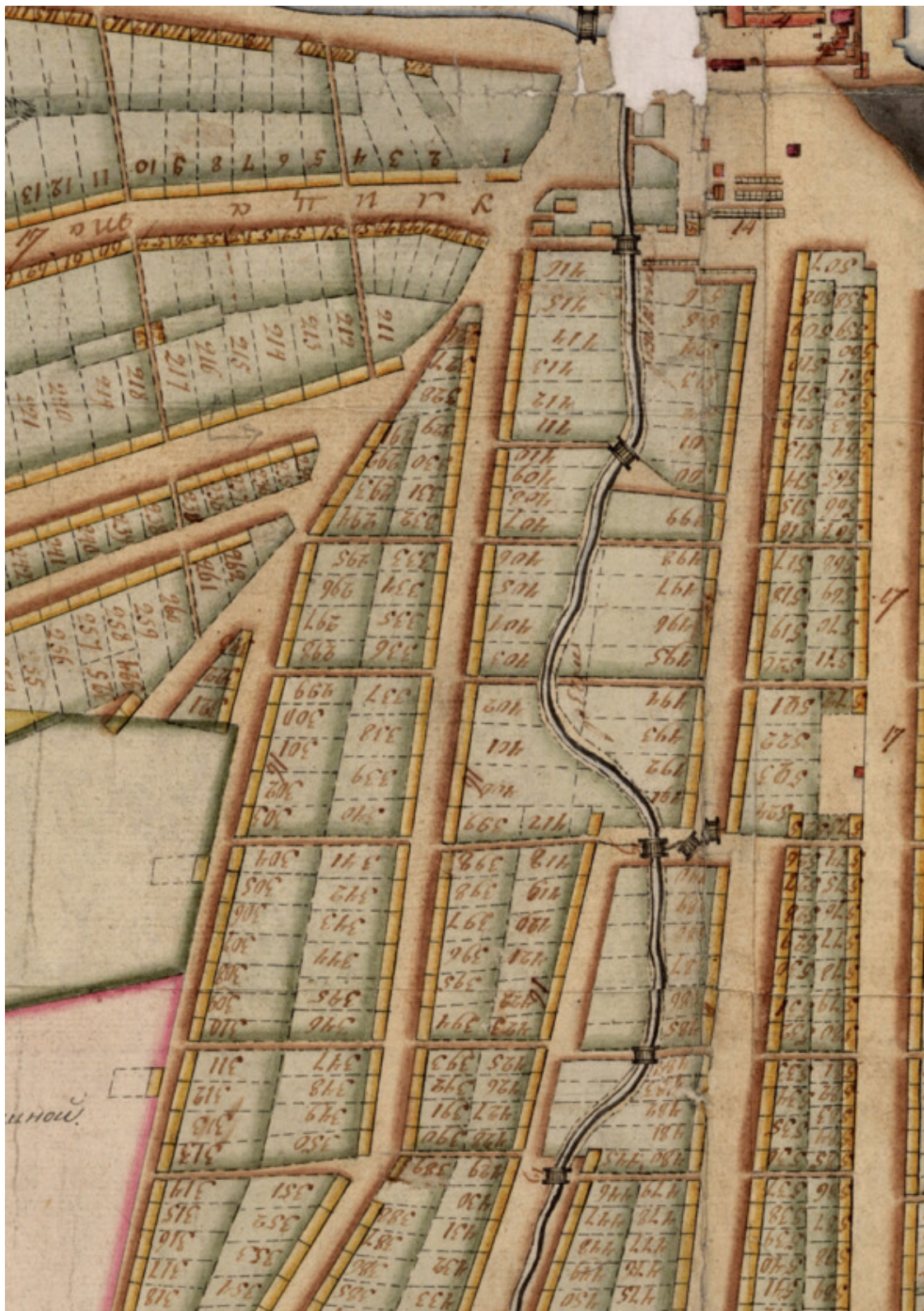
Фрагмент Плана Нижнетагильского завода: ул. по рудной дороге, ул. Большерудянская, ул. от могильника по течению речки Рудянки, ул. Верхнерудянская, ул. Извезная (начало)