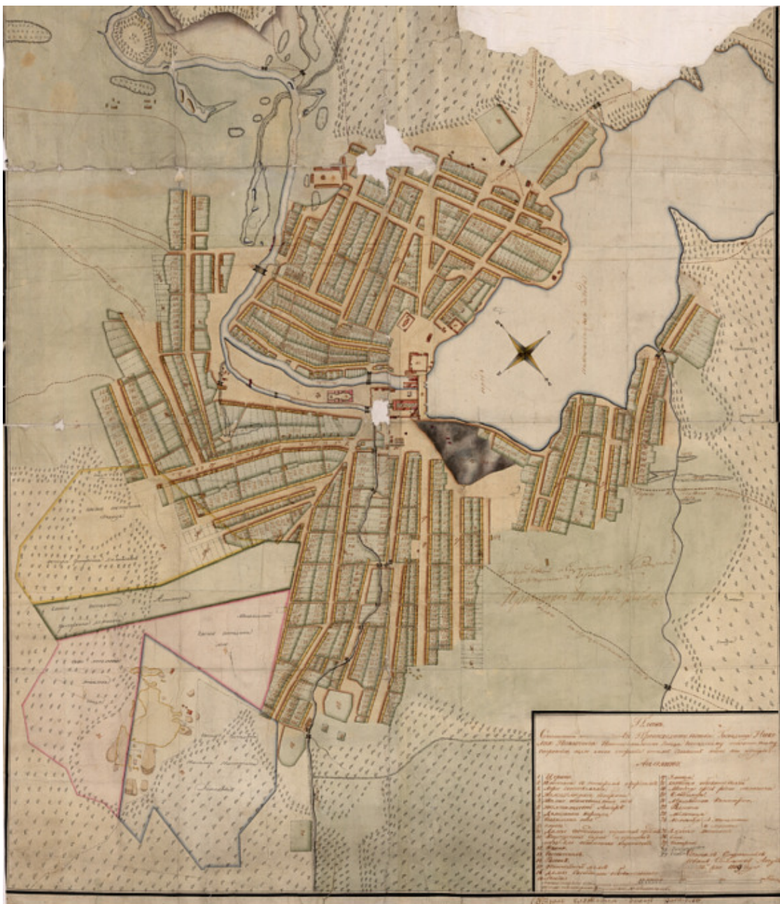
План Нижнетагильского завода, 1809 г.