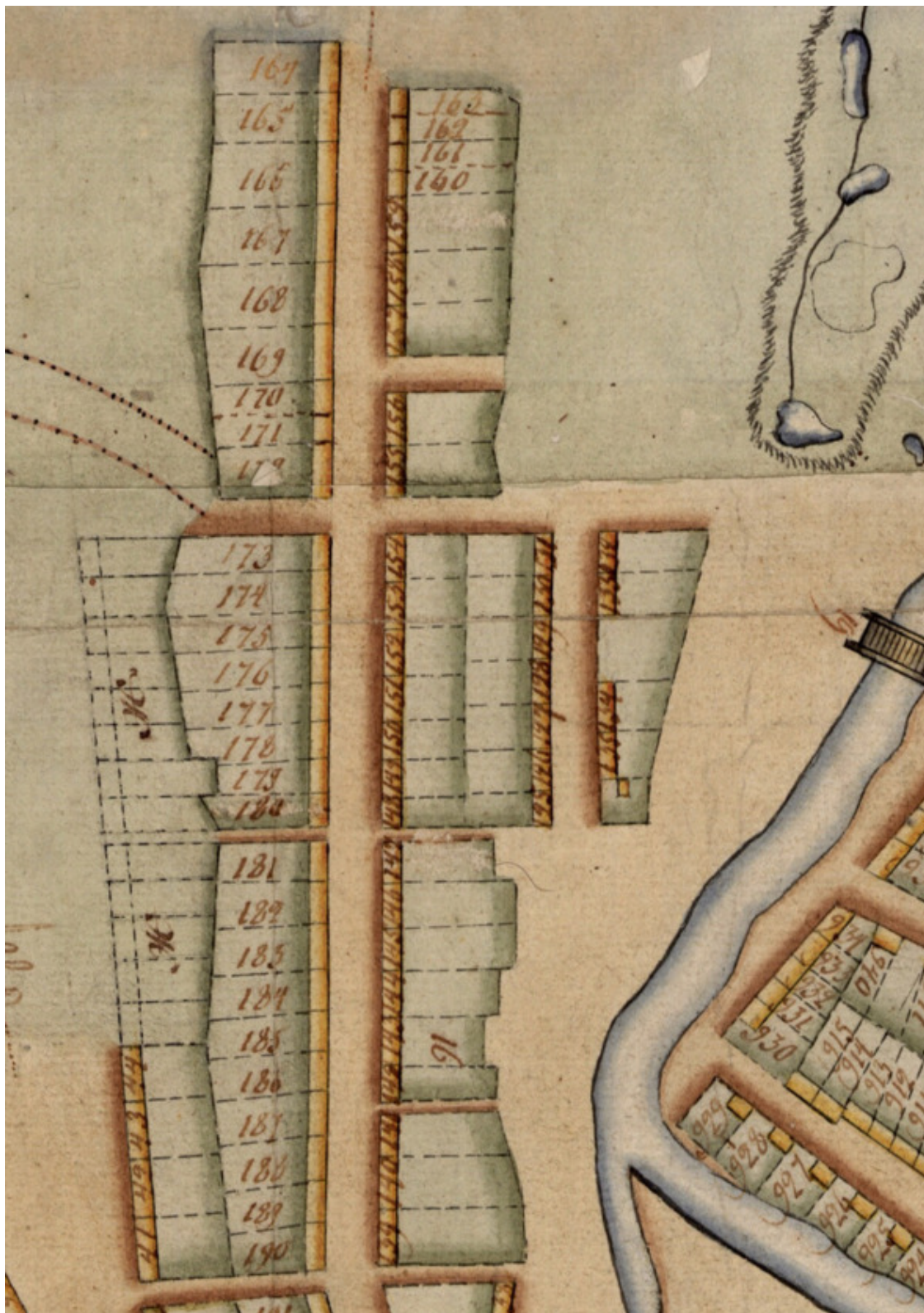
Фрагмент Плана Нижнетагильского завода: ул. Фокинская