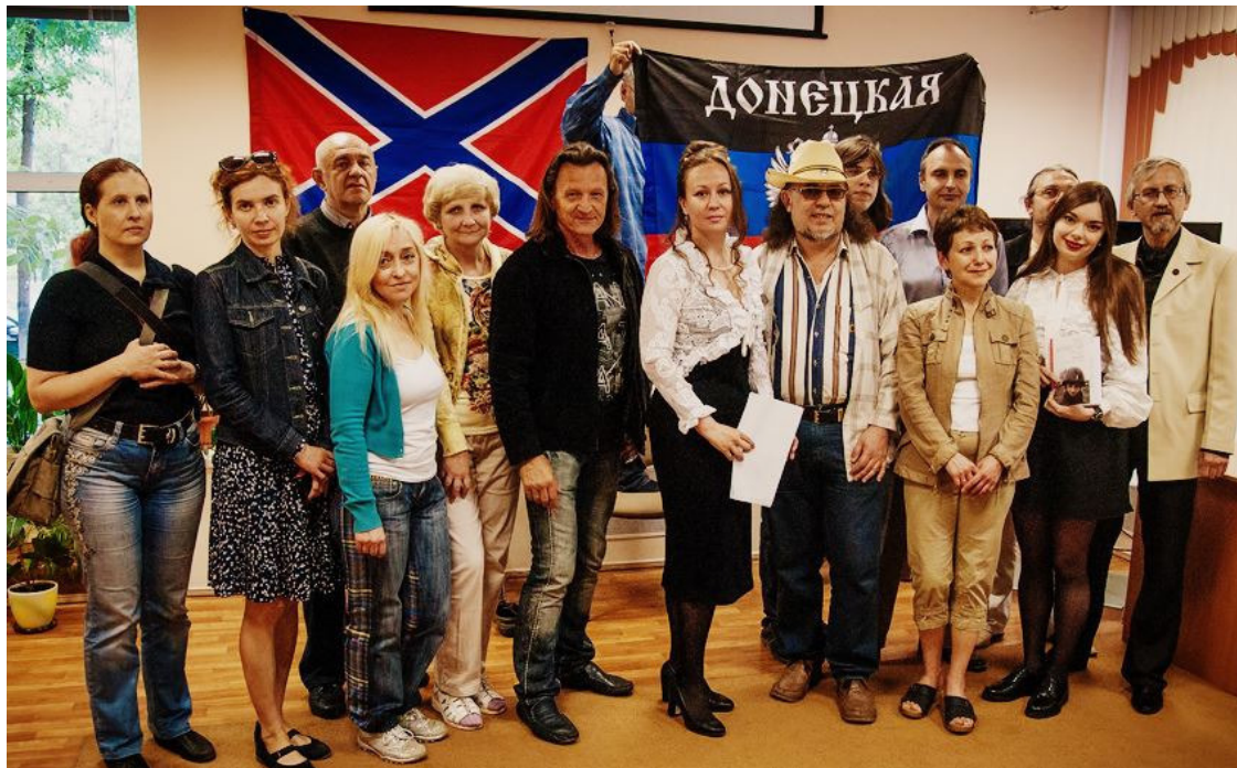
Участники встречи в Пушкинский день.