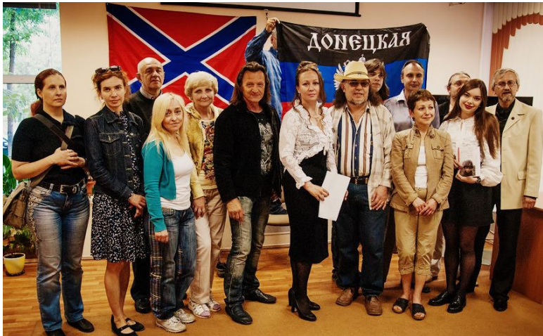
Участники встречи в Пушкинский день.