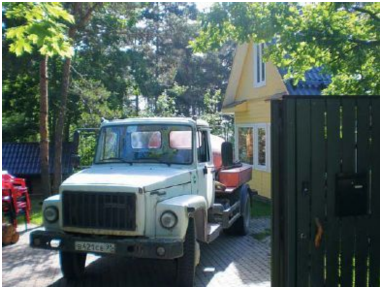
Рис. 2. Ассенизационная машина: а – возле частного дома;