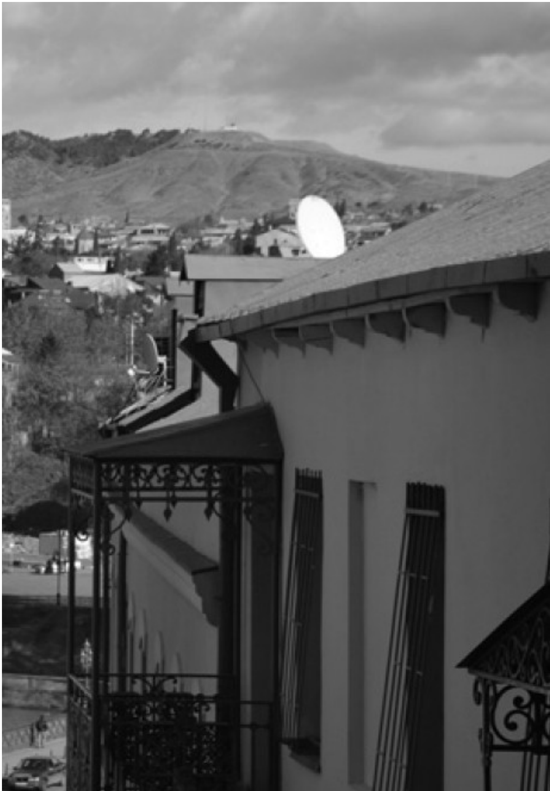
Тбилиси. Кафедральный собор Цминда Самеба

Задавал свои вопросы учителям – бесполезно; обратился к родителям, но они мне отвечали в таком роде, что я не совсем исчезну, а буду жить в памяти других людей. Но и такое странное объяснение меня совсем не устраивало. Мы с одноклассниками всегда много спорили