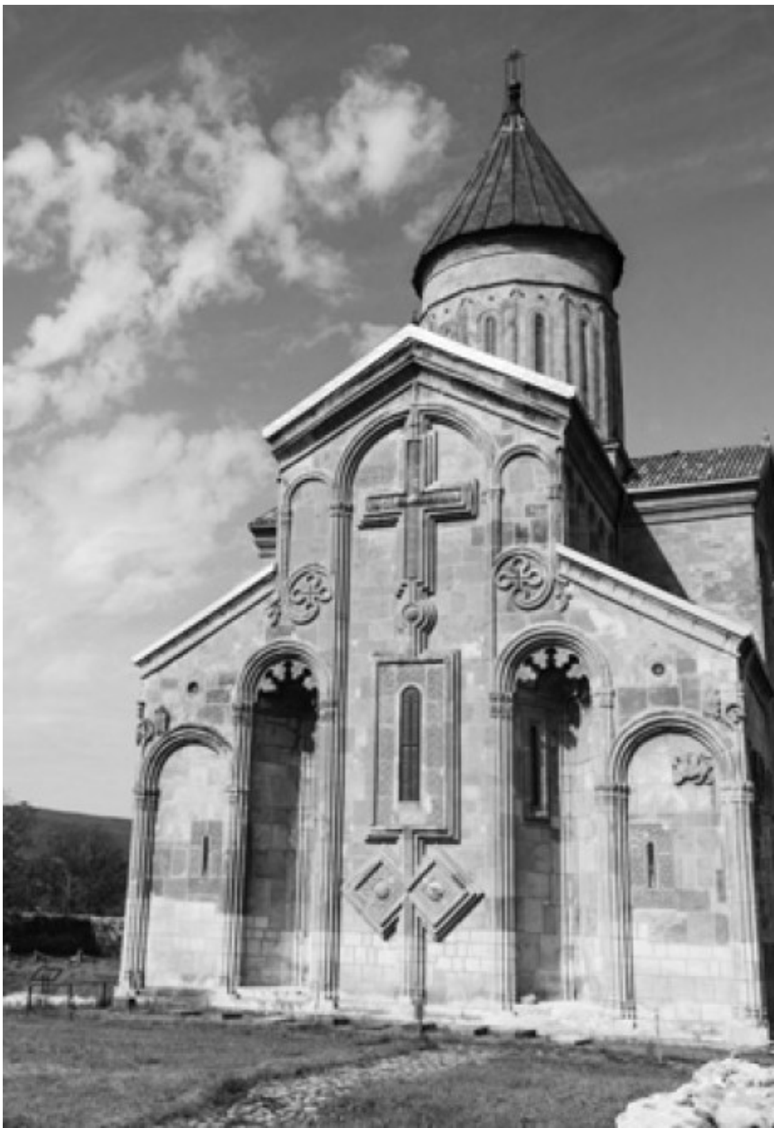
Самтависи. Собор Воскресения Господня

Помню свое удивление и радость, когда я впервые оказался в обществе верующих людей. Как-то услышал, что священник со своими прихожанами собирается поехать в паломничество