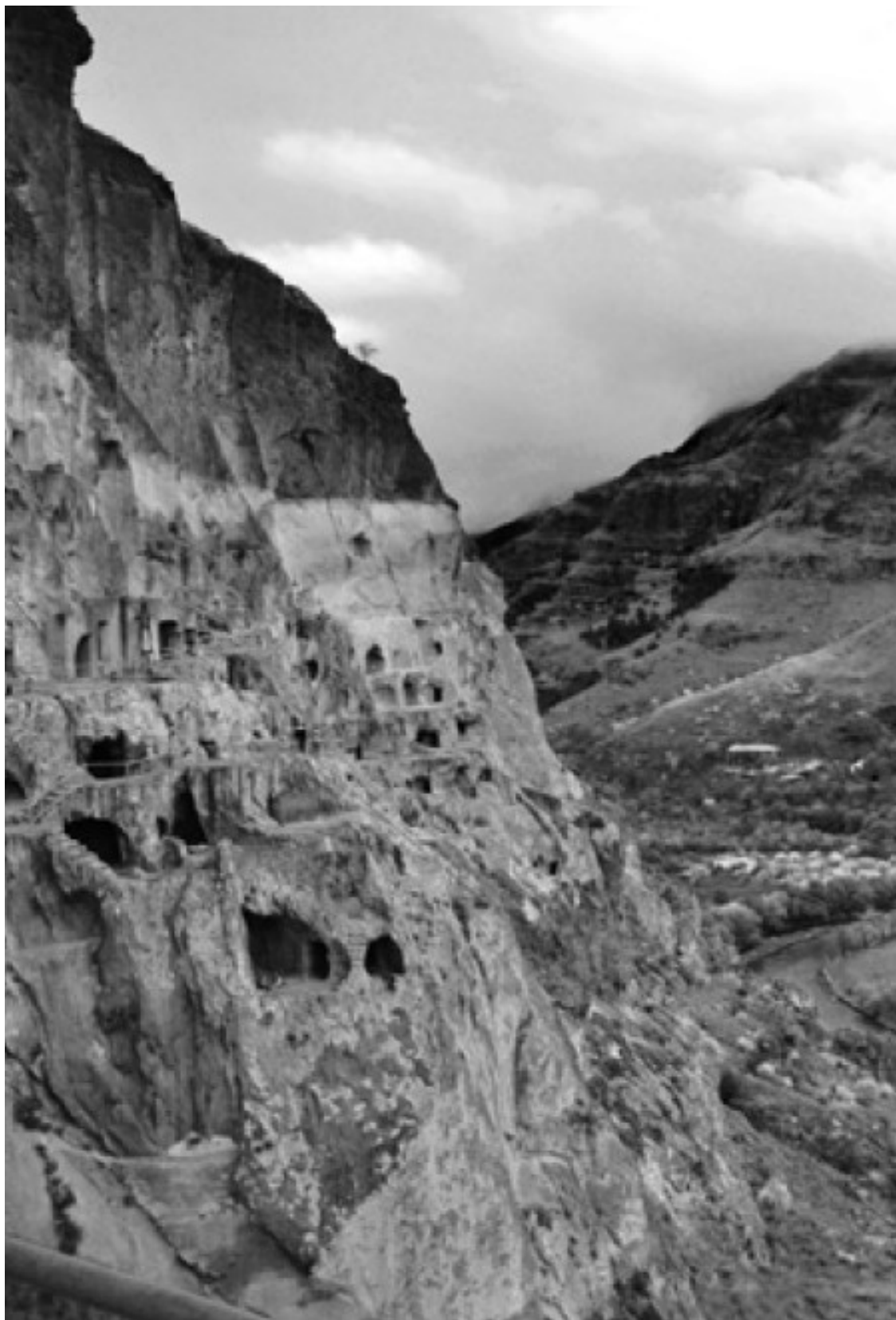
Джаваheti. Пещерный монастырь Вардзиа

И в этом долгом многодневном пути мы почувствовали, что значит Евангелие в действии: когда человек начинает правильно жить, Господь являет ему знаки. Например, в один из очень