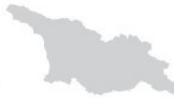
Схема канонической территории Грузинской Православной Церкви на переднем форзаце