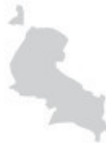
Схема Тбилиси и Мцхета на заднем форзаце