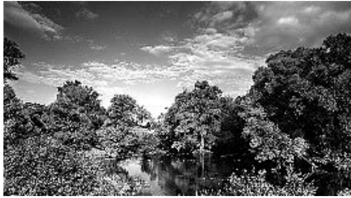
Рис. 3. Река Сейм.

24) Псьол (Песел, Псло, Псол), л. Днепра – от *p [h] – «брат, хватать» и *sol- «обозначение здоровья, целостности» [1, с. 247, 812]. Сравним: в Украине есть реки Здарівка (Здоровка, Здоровець) и Хватівщина [21, с. 212, 588].