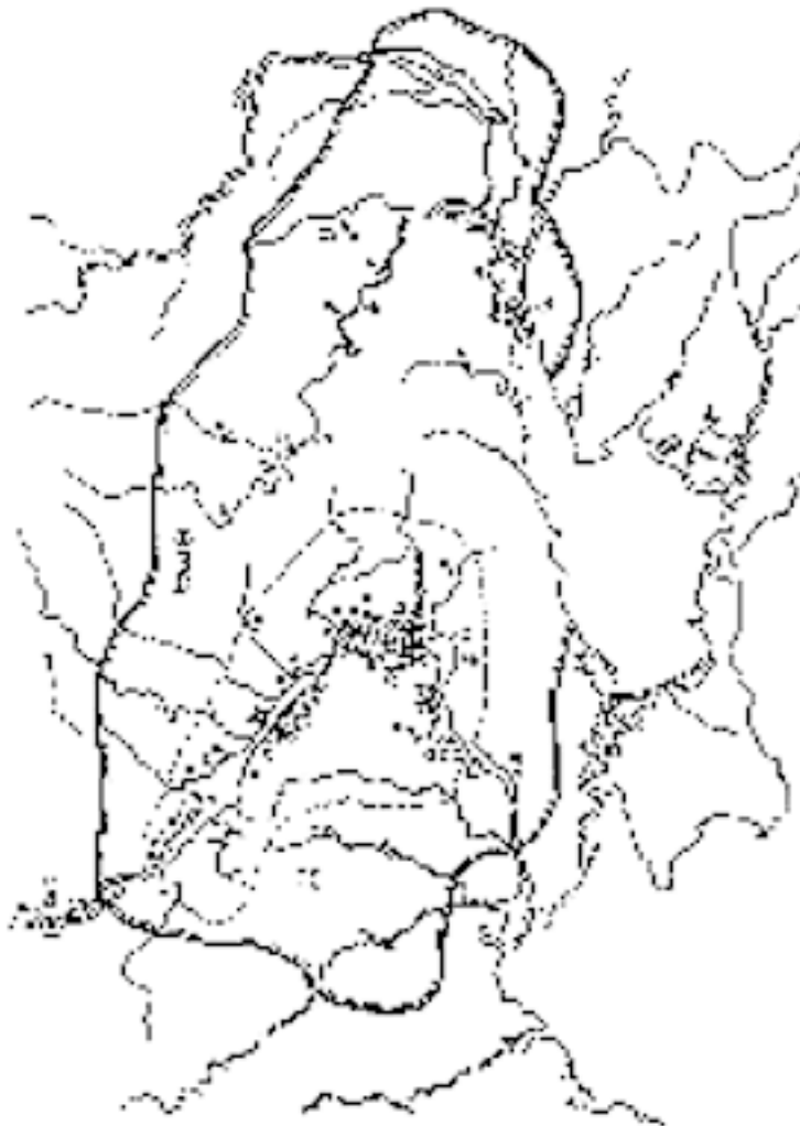
Рис. 2. Карта распространения среднестоговской культуры [2, с. 24–25]. Пунктиром обведена приблизительная территория самых ранних памятников – кувтинского этапа (I-а), в Надпорожье и Среднем Поднепровье [2, с. 123].

по ее мнению, исходный импульс, в результате которого наблюдается распространение индоевропейской курганной культуры не только в понто-каспийских степях, но и в Центральной и Северной Европе и на Балканах. Курганная культура, по Гимбутас, это – ямная культура, культура погребений с охрой, культура боевых топоров, культура шнуровых керамик, культура одиночных погребений Дании. Внешними признаками индоевропеизации являются, по Гимбутас, курганы и погребальный обряд в ямах, где обнаруживаются скелеты, лежащие скорченно на спине. Индоевропеизацию Европы она связывает с дезинтеграцией высоких цивилизаций Древней Европы V–IV тыс. до н. э. (Винча II–III, Лендьел, Тиссы-Бюкка, Кукутени-Триполье, Гумельницы), которые образовали неиндоевропейский субстрат на юго-востоке Западной Европы, и культуры воронковидных кубков – неиндоевропейского субстрата в Северо-Европейской равнине между Данией и Польшей. Постепенная инфильтрация с середины IV тыс. до н. э. в районы Западной Европы окончилась в 2500–2000 гг. до н. э. вторжением, в результате которого произошло окончательное разрушение остатков древнейших европейских цивилизаций, уцелевших только на Крите [5, p. 483; 6, p. 15].