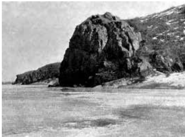
Рис. 4. Остров Хортица на Днестре. Фото 20-х гг. XX в. [13, с. 381].

31) Также имеет древнейшую индоевропейскую этимологию приводимое Геродотом (IV, 57, 123) название реки Сиргис [33, с. 253, 275], которым обычно считают Северский Донец. Это название можно произвести от и.-е. слов *ser- «двигаться» со значением «речка», «ручей» «спешить», *g [h] i- «зима» и маркера активного класса *-s [1, с. 227, 224, 374]. Сравним: в Украине есть реки Зимна Ріка, Зимна Вода и Зимуха [21, с. 214].