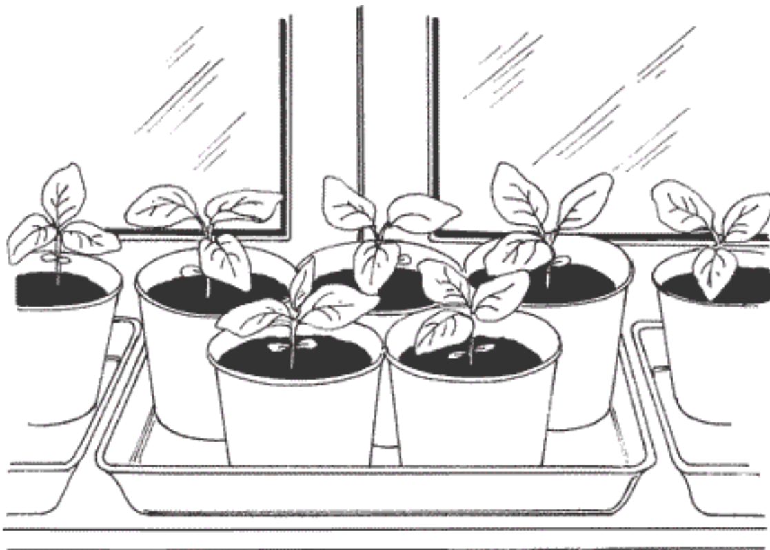
Рисунок 1. Выращивание рассады горшечным способом

Практически все дачники выращивают в домашних условиях одни и те же культуры. Чаще это помидоры, огурцы, баклажаны, капуста, тыква, кабачки, патиссоны и перцы (рис. 1).