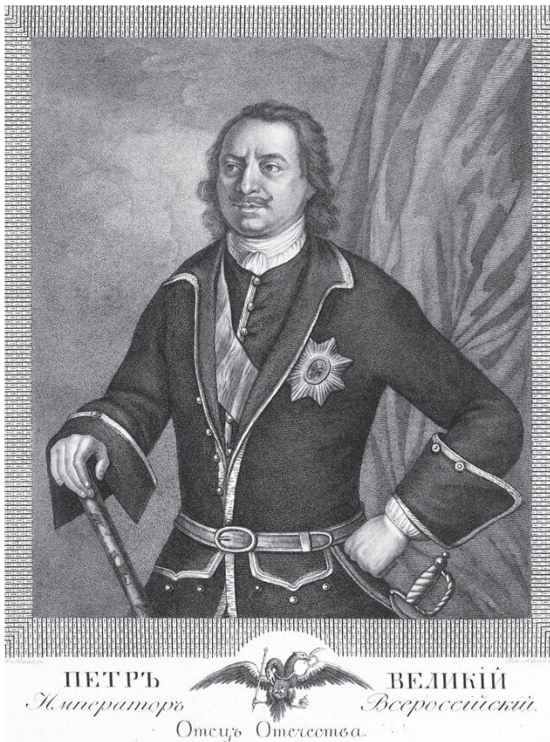
Петр Великий. Гравюра А. Афанасьева. XVIII в.