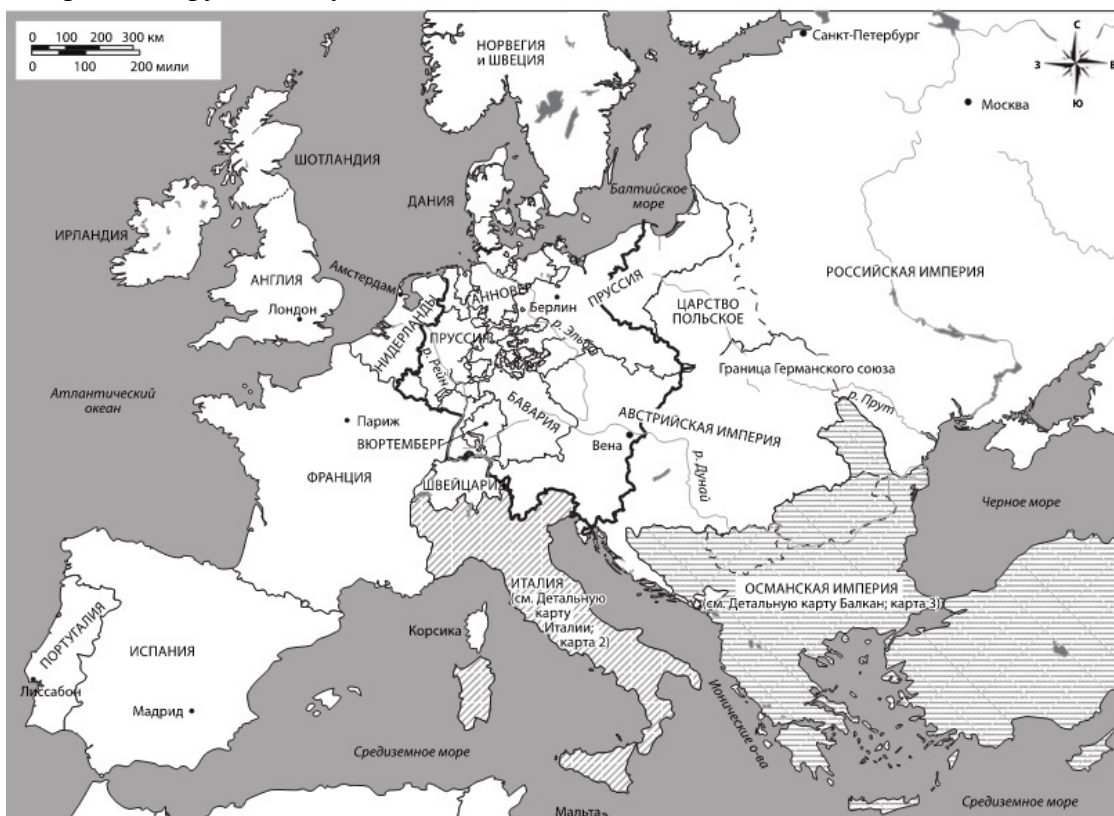
Карта 1. Европа в 1815 году.

В XIX веке в России использовался юлианский календарь (старый стиль), который на 12 дней отставал от грегорианского календаря, используемого в большинстве государств Европы (новый стиль). Поскольку российские дипломатические источники, как правило, указывают даты по старому стилю и далее (в скобках) по новому стилю, я вслед за российскими документами буду стараться приводить даты по двум календарям. Везде, где не указана дата по двум календарям, следует предполагать летоисчисление по новому стилю (несмотря на то что в российских источниках без двойного указания даты иногда непонятно, какое летоисчисление используется). При обсуждении внутренних дел России я использую даты по старому стилю, как это принято в русских научных исследованиях.