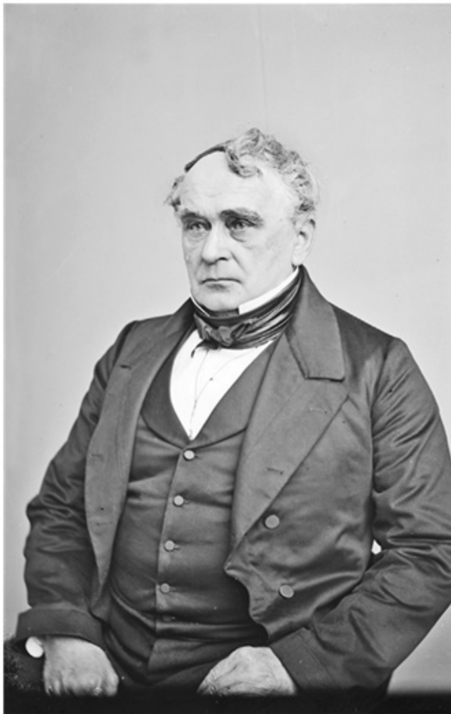
Илл. 2. Фрэнсис Либер, теоретик войны.

стве. Принципы Старого Света соединяются здесь с идеями Нового; следы наполеоновской эры, которую Либер застал в юности, смешиваются с юнионизмом образца 1861 года 130 .