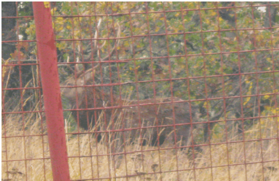
Рисунок 4. Самец пятнистого оленя в вольере заказника «Стрижамент»

На сегодняшний день численность оленя пятнистого в вольерах заказника «Стрижамент» составляет 50 особей (самцы – 14, самки – 24, приплод – 12).