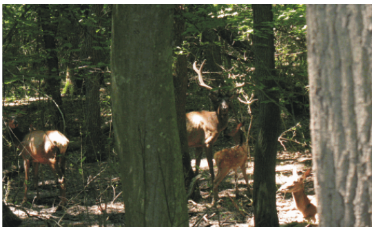
Рисунок 3. Благородные олени на территории вольера заказника «Сафонова дача»

дью 14,35 га, 10 особей оленя благородного возрастом до 5 лет (8 самок и 2 самца), привезенных из Алтайского края, рис. 3. В 2011 году на специально подобранном участке был построен вольер площадью 100 га.