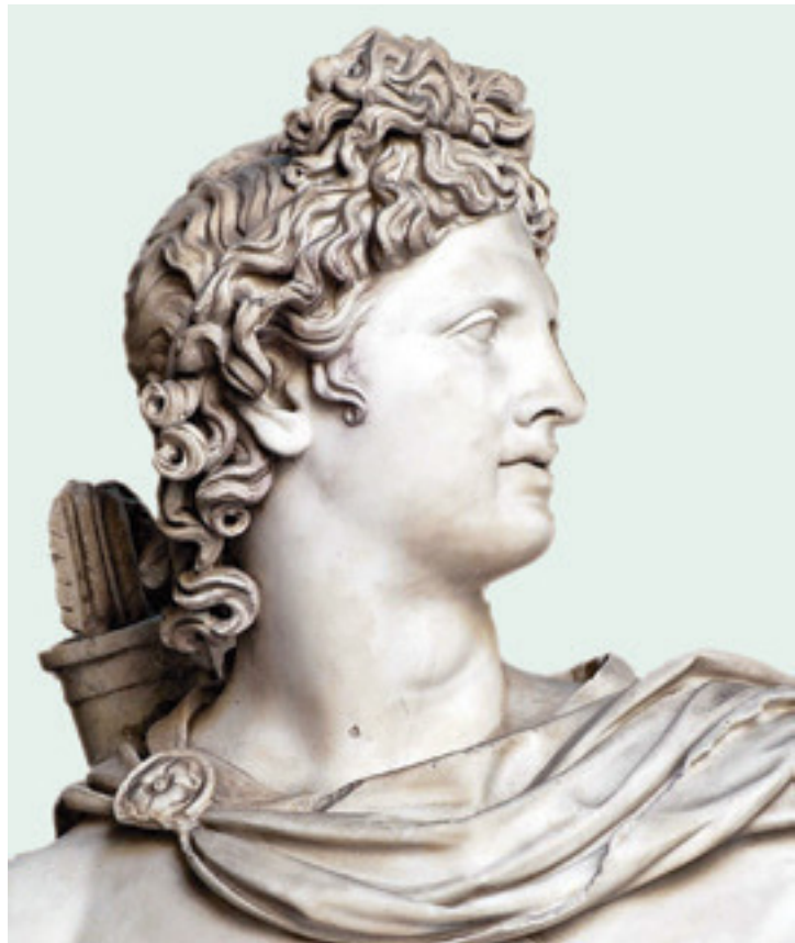
Бог солнца Аполлон