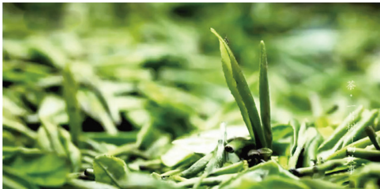
Кадр из «Чай. История одного листа»