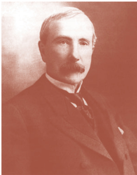
Джон Д. Рокфеллер

работе. Только в 16 лет он начал свою трудовую жизнь в качестве помощника бухгалтера на одной маленькой фирме. В 1855 году его зарплата составляла 300 долларов в год. Отец Рокфеллера помимо медицинской практики занимался ростовщичеством и привил сыну практический подход к жизни.