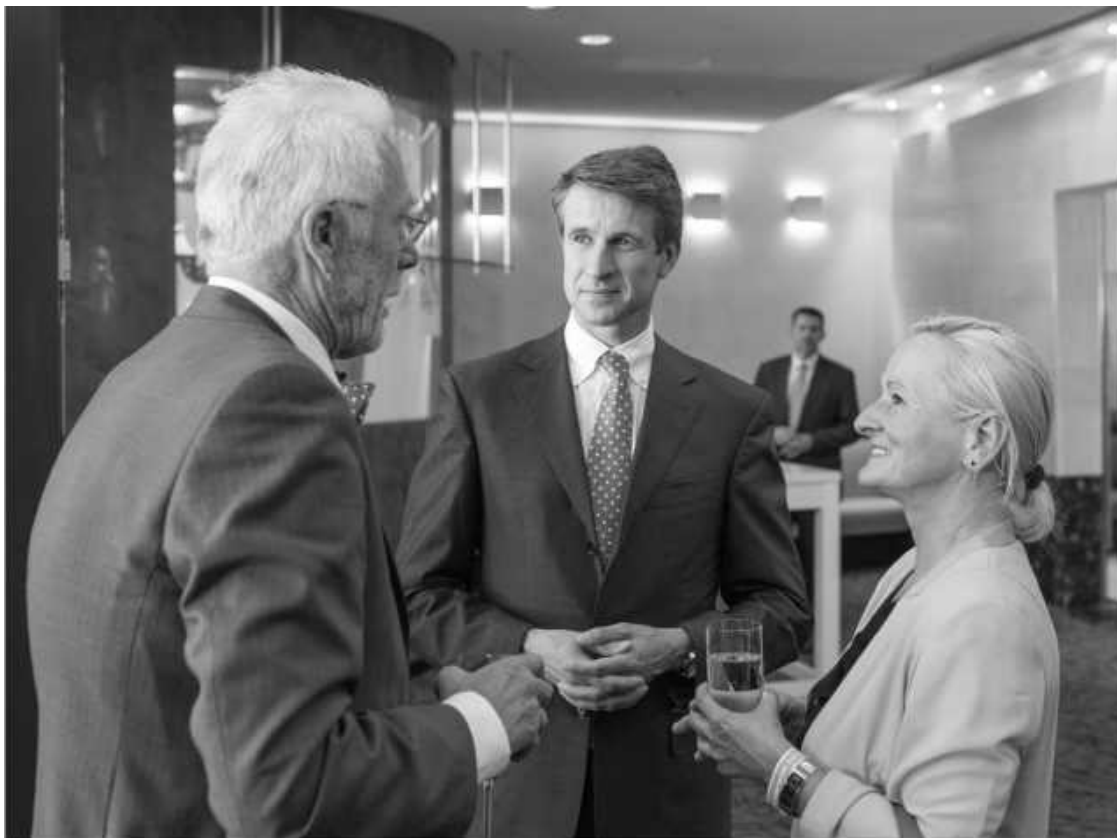
Штефан Квандт на вручении премии им. Герберта Квандта в области журналистики во Франкфурте, 2014 год

Но разве после смерти Герберта Квандта состав наследства и его размер не изменились? На самом деле ответ на этот вопрос утвердительный. За эти годы стоимость состояния Квандтов увеличилась в разы.