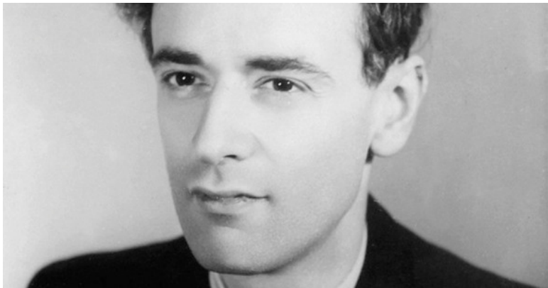
Л. Д. Ландау

– Нет, я вернусь в свою рабочую страну, и мы создадим лучшую в мире науку.