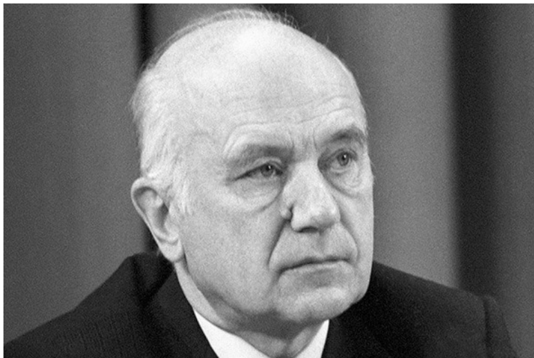
Б. В. Раушенбах

Ближайшим его соратником был Борис Викторович Раушенбах . В 30-е годы он увлекся планеризмом, не раз ездил испытывать планеры в Коктебель, где познакомился с Королевым и многие годы работал вместе с ним вместе в сфере космического ракетостроения.