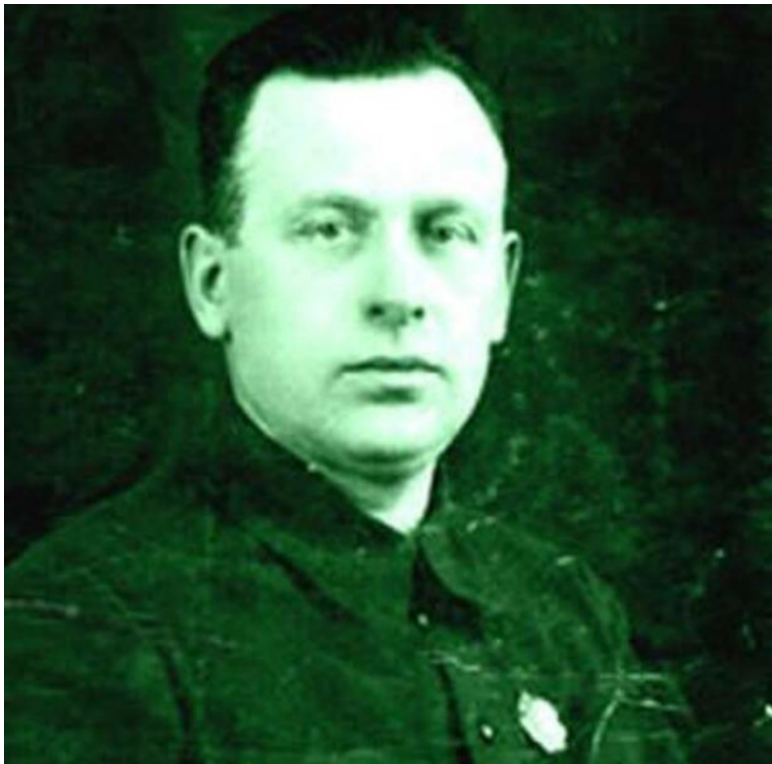
Я. Г. Таубин

Конструктор Яков Григорьевич Таубин , возглавлявший Особое конструкторское бюро №16 Наркомата вооружения, создал совместно с Михаилом Никитовичем Бабуриным автоматический станковый гранатомет, 23-мм авиапушку МП-6 (БТ-23) и 12,7 мм авиационный пуле-