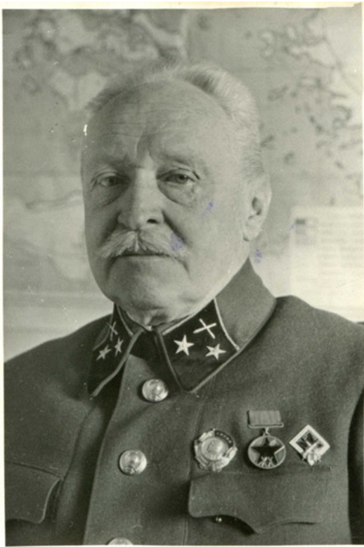
П. А. Гельвих

Петр Гельвих – основоположник русской школы теории артиллерийской стрельбы. Он первым в мире сформулировал теоретические основы рассеивания дистанционных разрывов. В годы Первой мировой войны – первым в России